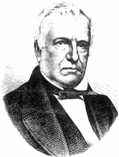
Sir Louis Hippolyte LaFontaine

Après avoir fureté sur plusieurs sites, ce Canadien de l'époque m'apparaît comme un batailleur intelligent qui fut constamment à la recherche de compromis sans pour autant abandonner ses convictions. Voici une brève biographie de Sir Louis Hippolyte LaFontaine.