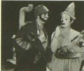
"Sol et Gobelet"