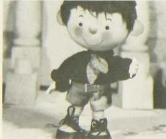
"Les Aventures de Oui-Oui"