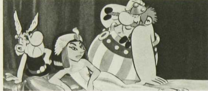
"Astérix et Cléopâtre"