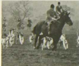
"Les Chevaux du soleil"