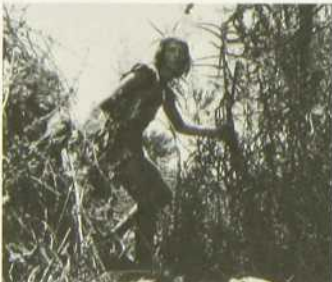
"L'Enfant de la forêt"