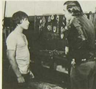
"Le Jeune Fabre"