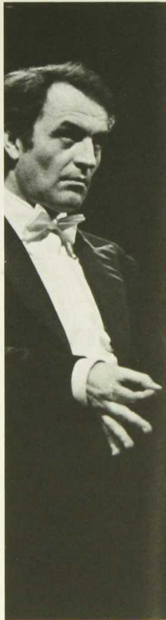
Charles Dutoit, directeur musical et chef attitré de l'Orchestre symphonique de Montréal