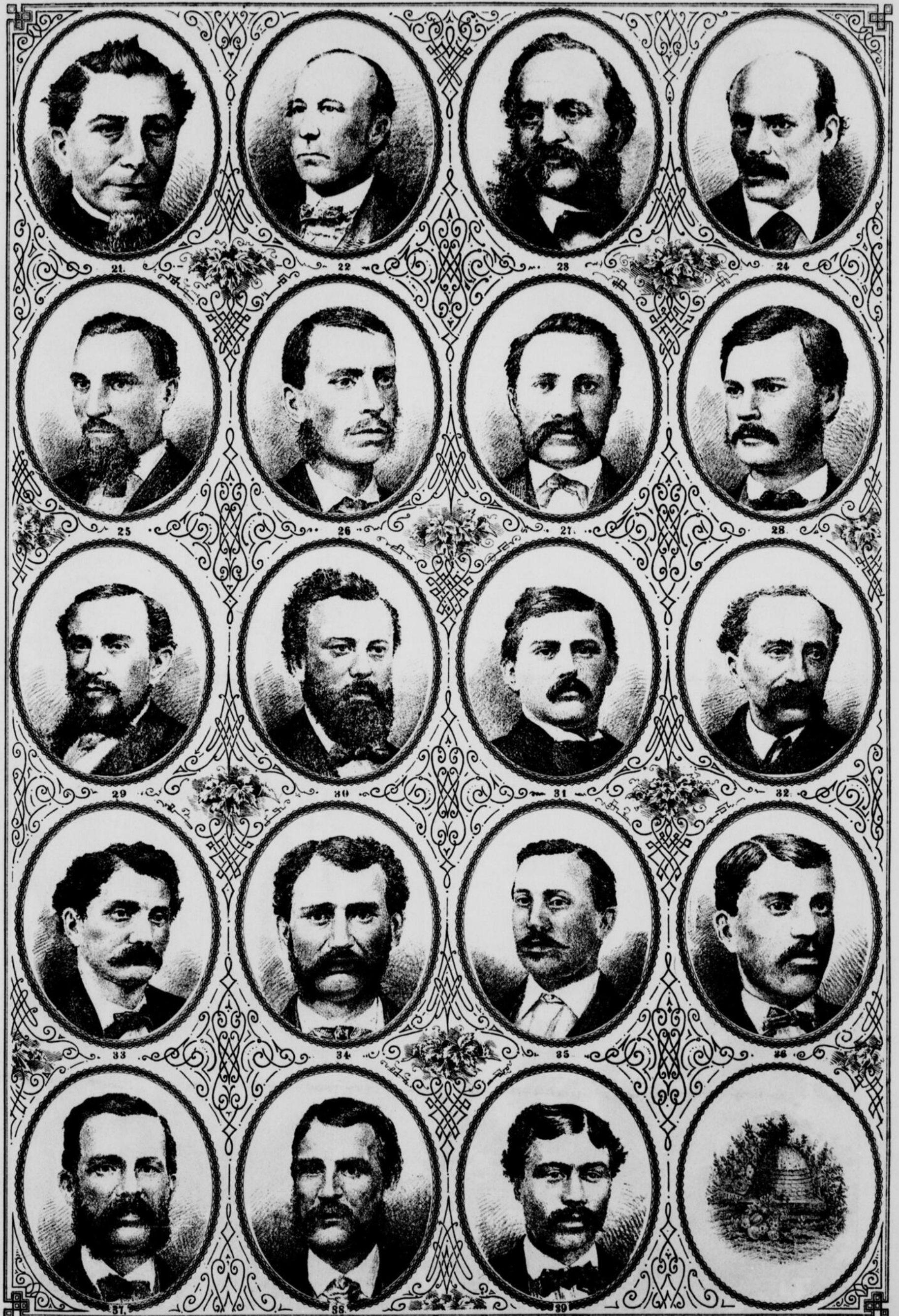
PORTRAITS DES DÉLÉGUÉS À LA 7 me CONVENTION NATIONALE DES CANADIENS ÉMIGRÉS, Tenue à Worcester, Mass., les 15, 16 et 18 Septembre, 1871.