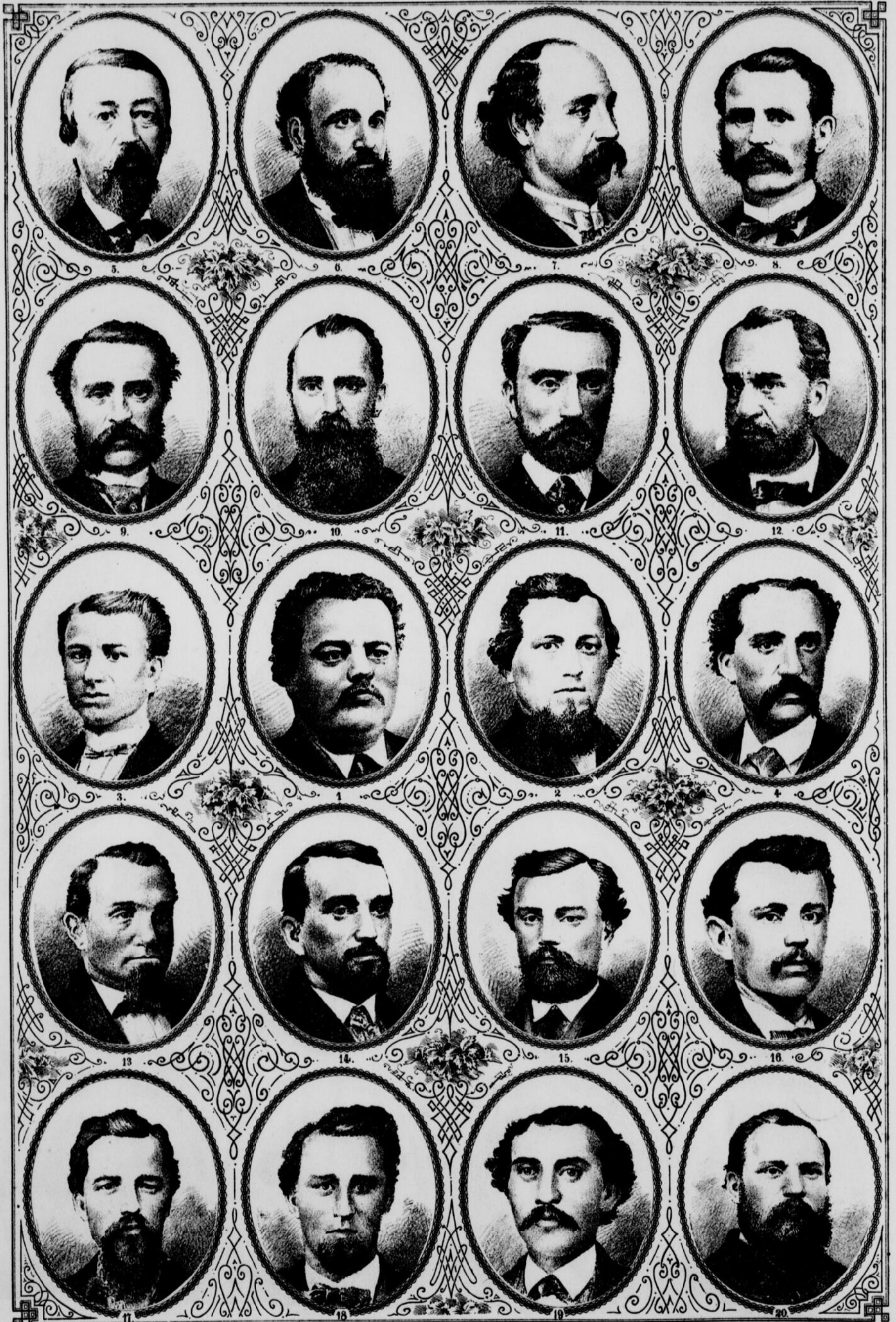
PORTRAITS DES DÉLÉGUÉS À LA 7 me CONVENTION NATIONALE DES CANADIENS ÉMIGRÉS, Tenue à Worcester, Mass., les 15, 16 et 18 Septembre, 1871.