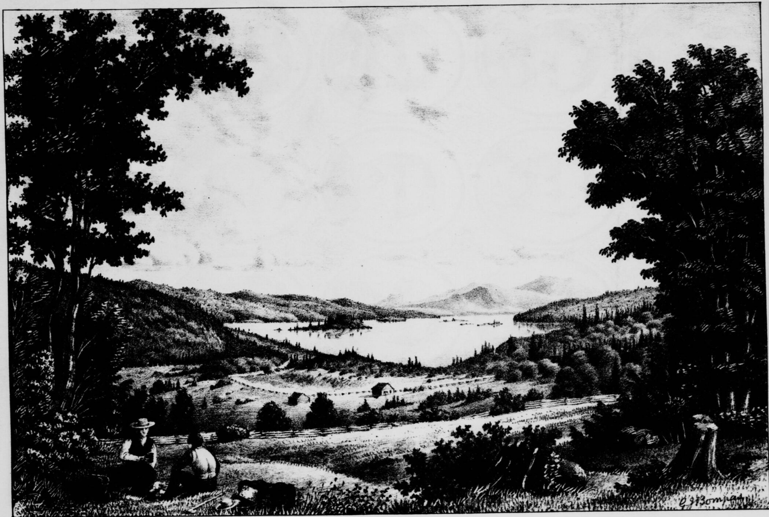
LE LAC NICOLET, VU DU NORD-EST.—D'APRÈS UN DESSIN DU DR. GEO. J. BOMPAS.