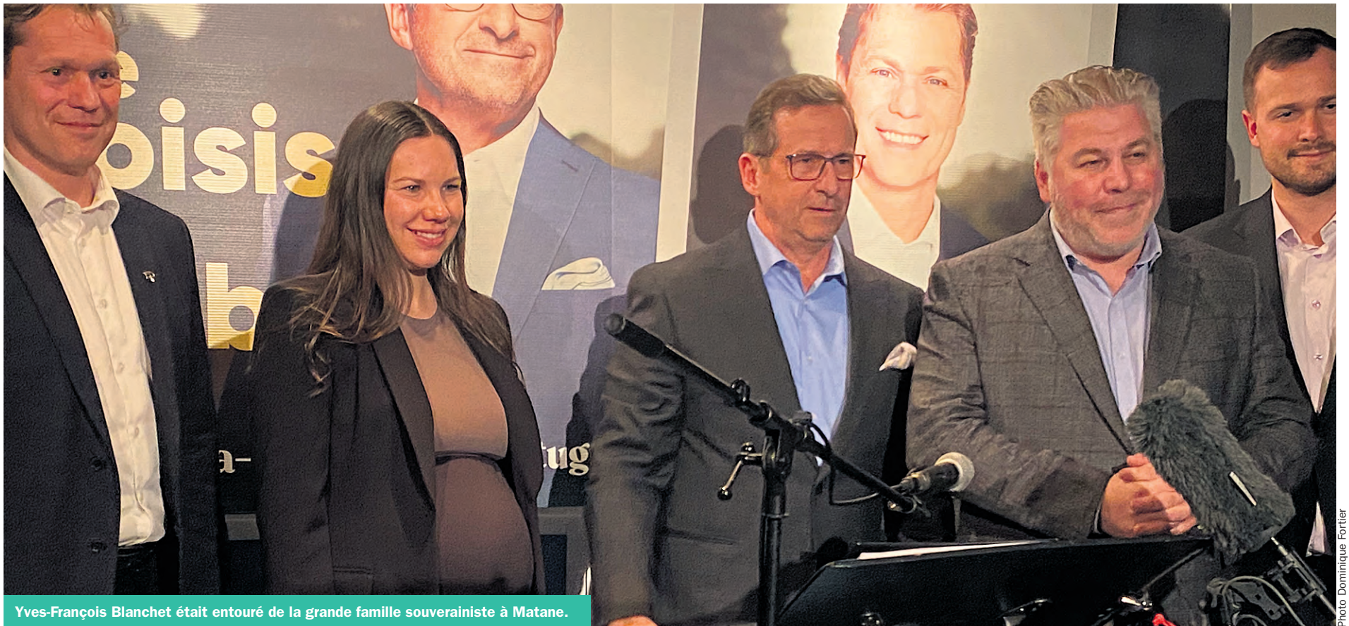
Yves-François Blanchet était entouré de la grande famille souverainiste à Matane.