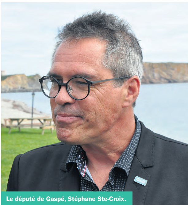
Le député de Gaspé, Stéphane Ste-Croix.

Stéphane Ste-Croix espère qu'il y aura une meilleure compréhension des enjeux et des actions qui y seront rattachées. «Quand je regarde l'idée de mettre en place une zone restrictive au niveau de l'habitat du caribou de 5 000 km2 alors qu'il y a déjà des réserves fauniques