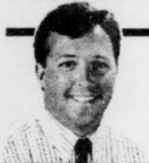
Textes de Carl TARDIF

De retour du camp d'entraînement des Flyers, Patrice Paquin aura besoin d'un petit cours d'orientation. « Le jeu est pas mal différent là-bas. Ici, ça devient frustrant de toujours être accroché. »