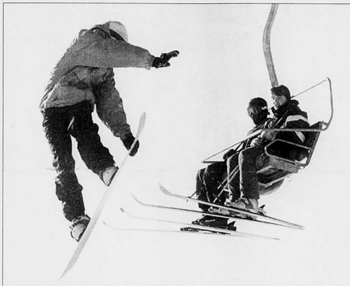
MARTIN C. CHAMBERLAND LE DEVOIR

PAR un étonnant jeu de perspective, le surfeur de notre photo s'est retrouvé nez à nez avec deux skieurs qui remontaient le mont Saint-Bruno à bord du télésiège. Bien que le froid soit mordant, les conditions de ski sont plutôt belles sur les pentes de la grande région de Montréal.