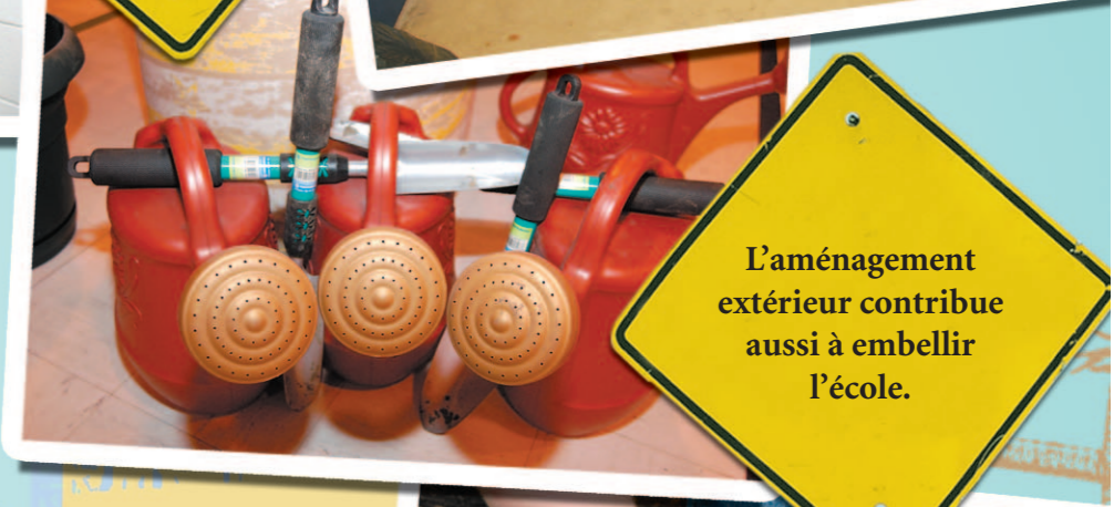
L'aménagement extérieur contribue aussi à embellir l'école.

L'AN DERNIER, PRÈS DE 3 000 ÉLÈVES, PARENTS ET AMIS DE LA CSDM ONT PARTICIPÉ BÉNÉVOLEMENT À LA CORVÉE AU NET DANS 65 ÉCOLES. SOUS LE THÈME « MOUSSEZ VOTRE ÉCOLE! », ILS ONT MANIÉ LES PINCEAUX, NETTOYÉ DES LOCAUX, AMÉNAGÉ DES TERRAINS EXTÉRIEURS, ETC. DANS LE QUARTIER, LES ÉCOLES SUIVANTES ONT ÉTÉ RAFRAÎCHIES :