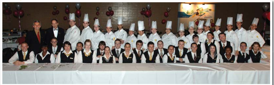
Les élèves de l'école hôtelière de la Capitale ont préparé un banquet digne des plus grands chefs!

Production : Secrétariat général et direction de l'information et des communications • Infographie : Extrême Concept