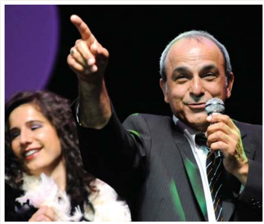
Charles Aznavour, For me formidable , le sympathique Munir Gundog, de l'ÉMOICQ.