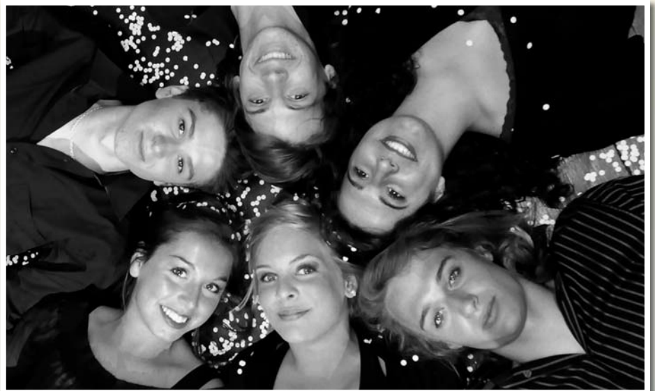
Les élèves de l'école secondaire Roger-Comtois ont figuré dans différents tableaux tout au long de la soirée.