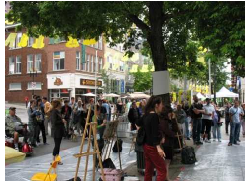
Rue Sainte-Catherine durant la piétonnisation.