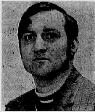
par Noël Bouchard