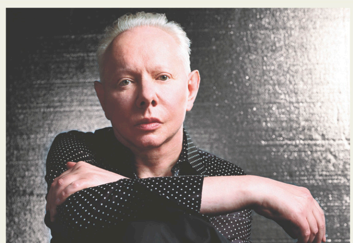
FESTIVAL INTERNATIONAL DE JAZZ DE MONTRÉAL

D Lire aussi | La critique du spectacle de Joe Jackson au Théâtre Maisonneuve par Sylvain Cormier, sur l'application tablette et le site Web du Devoir .