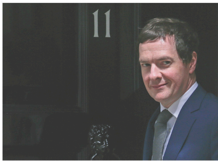
Le ministre britannique des Finances, George Osborne

Avant le référendum, il avait dramatisé l'impact négatif attendu du Brexit sur l'économie britannique qui