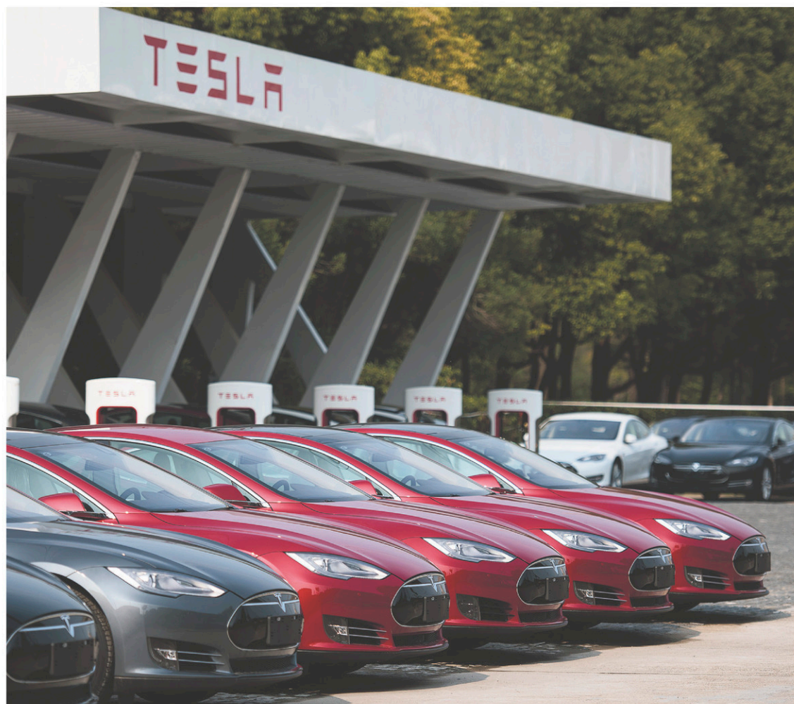
Au premier trimestre, Tesla Motors a produit 14 820 véhicules alors que son objectif était de 16 000.