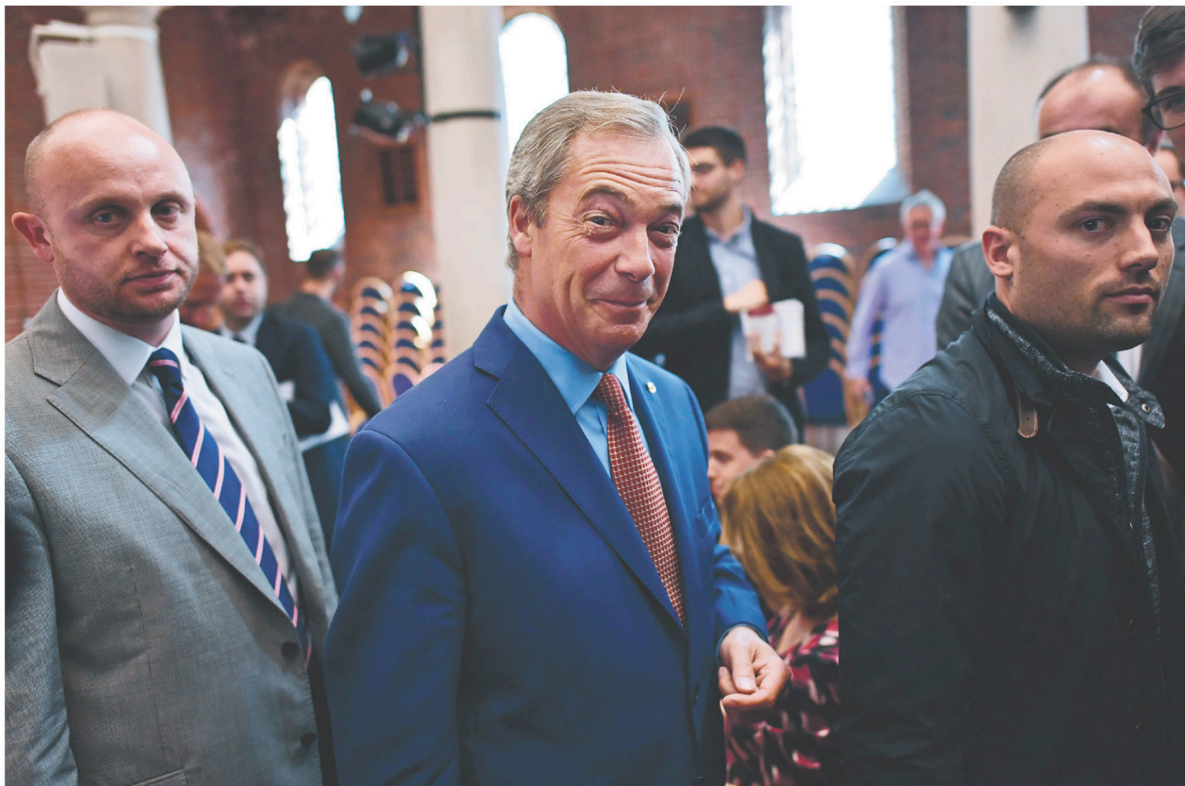
Nigel Farage (au centre) a surpris tout le monde lundi matin en annonçant qu'il démissionnait de son poste de chef de l'UKIP.