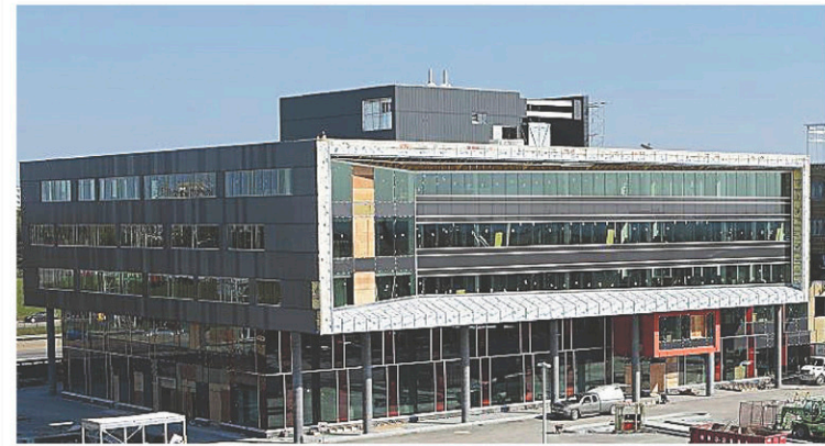
FACEBOOK NORDA STELO Le bâtiment de la firme d'ingénierie Roche