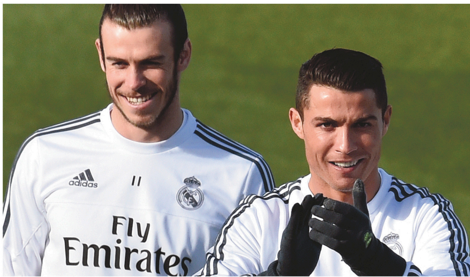
Les attaquants Gareth Bale et Cristiano Ronaldo sont coéquipiers au sein du Real Madrid.