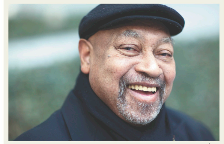
FESTIVAL INTERNATIONAL DE JAZZ DE MONTRÉAL

D Lire aussi | La critique du spectacle de Joe Jackson au Théâtre Maisonneuve par Sylvain Cormier, sur l'application tablette et le site Web du Devoir .