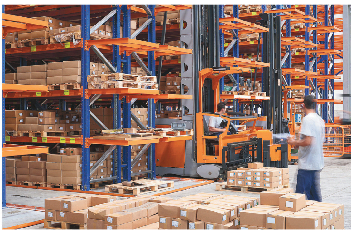
La croissance de la demande des États-Unis et la faiblesse du dollar canadien restent des éléments clés dans les prévisions de meilleures ventes.