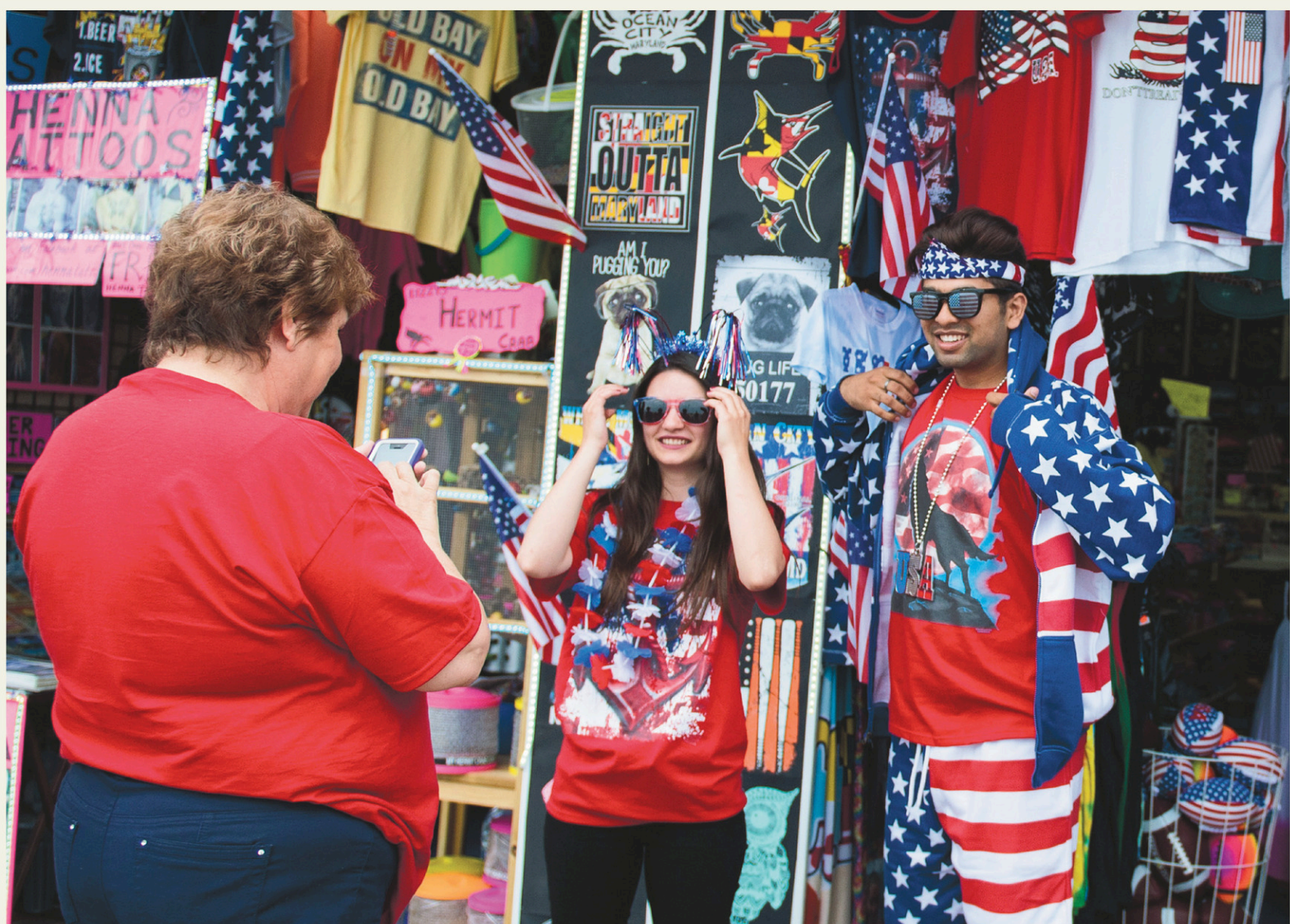
ANDREW CABALLERO-REYNOLDS AGENCE FRANCE-PRESSE