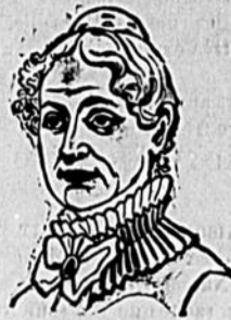
Mesieurs les Éditeurs :

Le portrait ci-dessus est une bonne ressemblance de Madame Lydia E. Pinkham, de Lynn, Mass., qui avant tous les autres êtres humains, peut-être véritablement appelé :