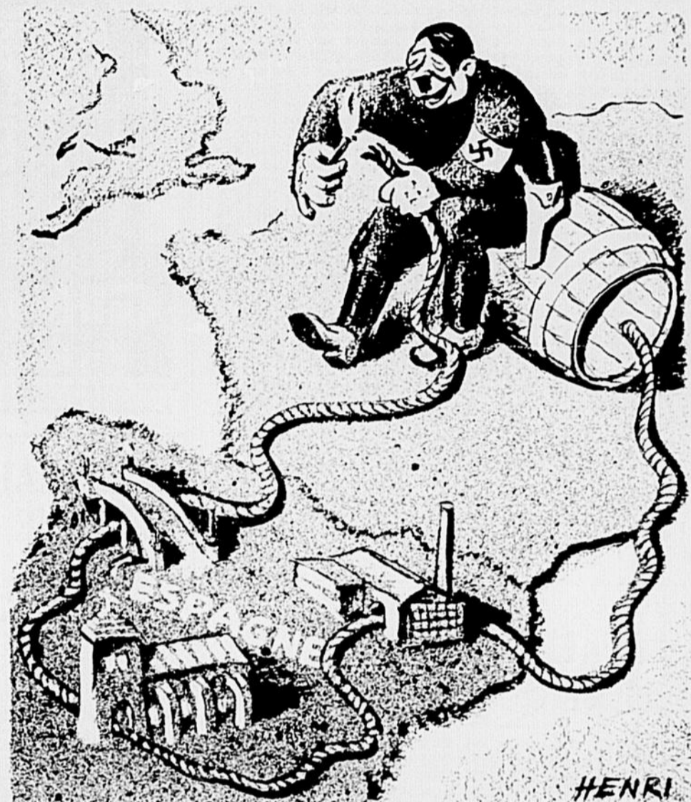
Bébé Hitler (l'air plus balourd qu'intel ligent). — Y a rien que j'aime tant, moé, que de faire sauter mes jouets en l'air. Attendez un tout petit peu et vous allez voer ce que vous allez voer!

Le maire Raynault, chauffé à blanc, s'est défendu au Conseil d'avoir voulu imposer "son" exécutif. Ce qui lui importe, a-t-il prétendu, est la réalisation de son programme. Comme ce programme comporte en tout premier lieu d'aboli-