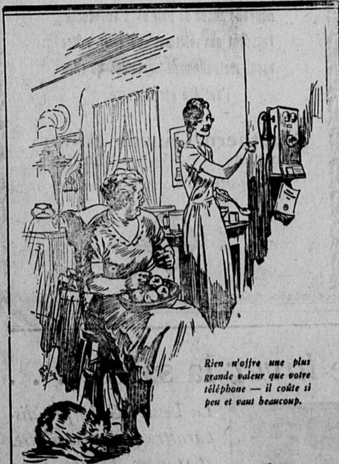
Rien n'offre une plus grande valeur que votre téléphone — il coûte si peu et vaut beaucoup.