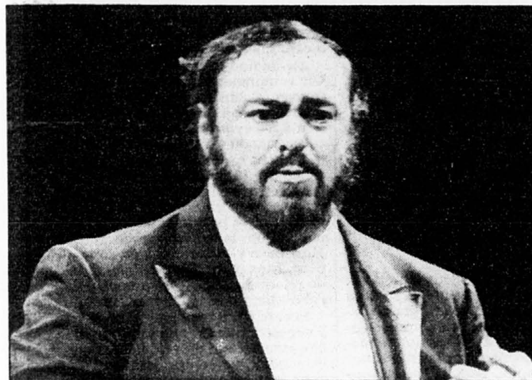
Luciano Pavarotti chante demain soir au Centre Molson.