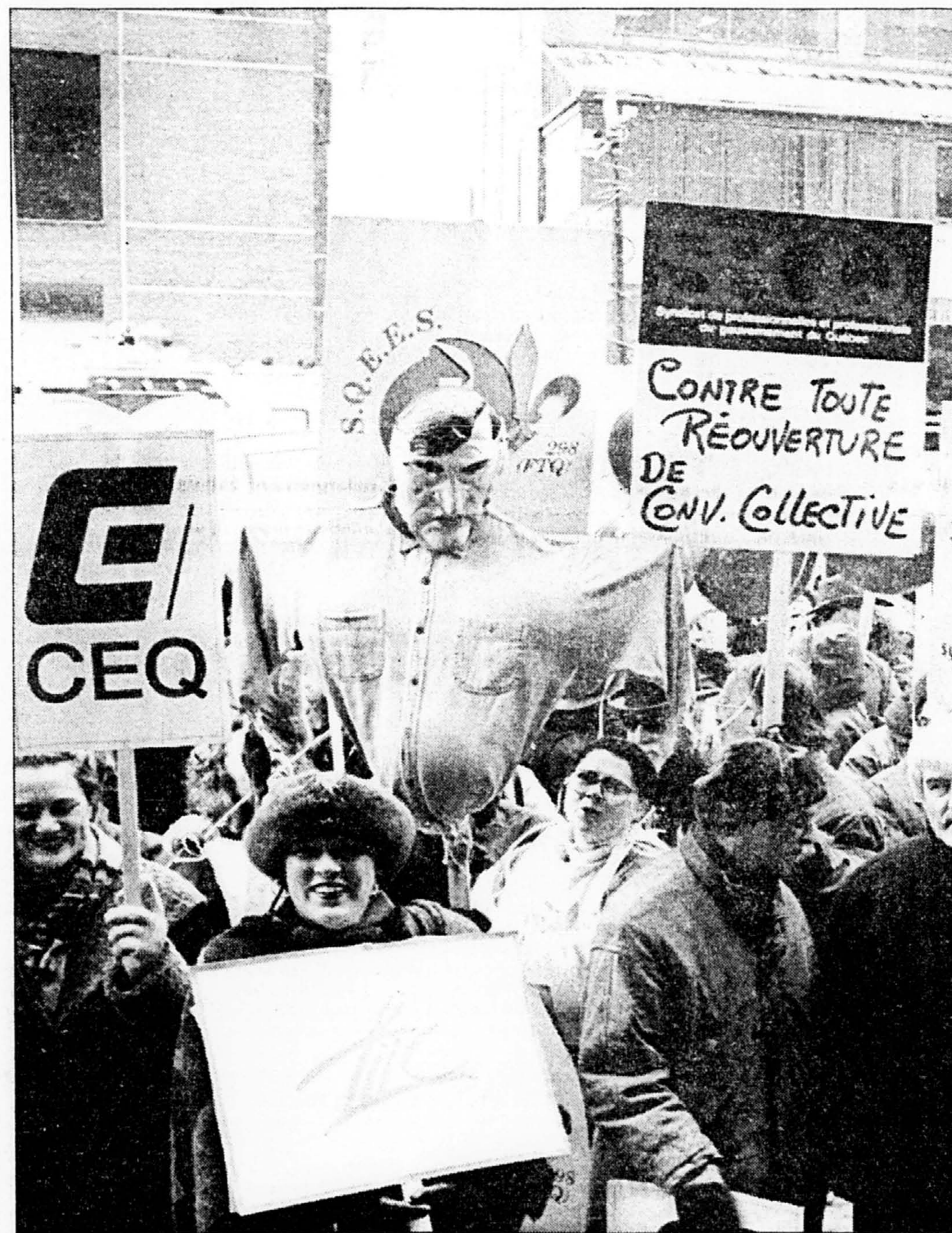
Environ 250 syndiqués du secteur public ont participé, hier, à la manifestation devant le siège social d'Hydro-Québec.

Entre-temps, le vote par correspondance des membres du Bloc va bon train. Hier, près de 40 000 bulletins de vote étaient parvenus à la permanence du Bloc, qui en recevra encore jusqu'en fin de journée jeudi, ce qui lui donne bon espoir d'enregistrer une participation de 50% ou plus des militants au choix du nouveau leader.