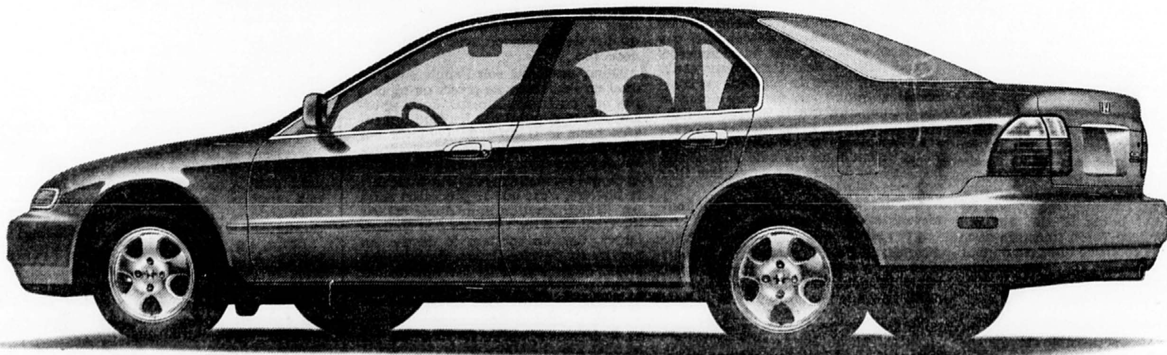
BERLINE ACCORD SE « ÉDITION SPÉCIALE » 1997

Une berline unique en son genre. Trois bonnes raisons de l'adopter.