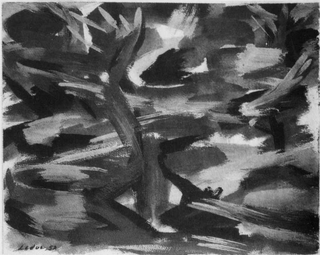
Cévennes, 1952, de Fernand Leduc