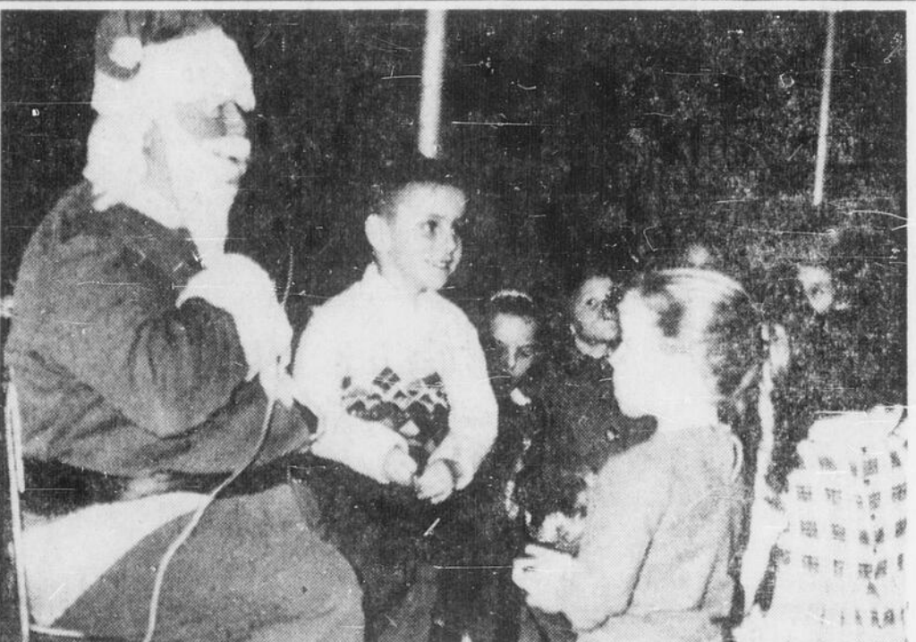
MAIS C'EST BIEN LE PERE NOEL! — Ainsi semble dire la petite faisant face à ce personnage légendaire, à la longue barbe blanche. La scène s'est produite à Chelmsford, lors d'une récente distribution de cadeaux aux enfants, par les membres de la Légion canadienne de cet endroit. Les enfants n'ont aucune crainte pour ce bon vieillard.