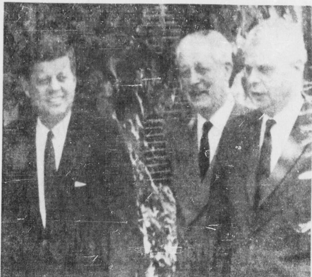
TROIS GRANDS A NASSAU — M. John Dieffenbaker, le premier ministre du Canada, à droite dans la photo, a rencontré à Nassau les deux grands chefs du monde occidental, le président des Etats-Unis M. John Kenney, à gauche dans la photo, et M. Harold Macmillan, le premier ministre de Grande-Bretagne. M. Dieffenbaker est arrivé dans la capitale des Bahamas, à la fin des entretiens entre MM. Macmillan et Kennedy. La photo a été prise alors que les trois chefs d'Etat se promenaient dans un jardin, à Lyford Cay.