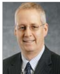
Claude Blouin Sous-ministre adjoint Emploi-Québec