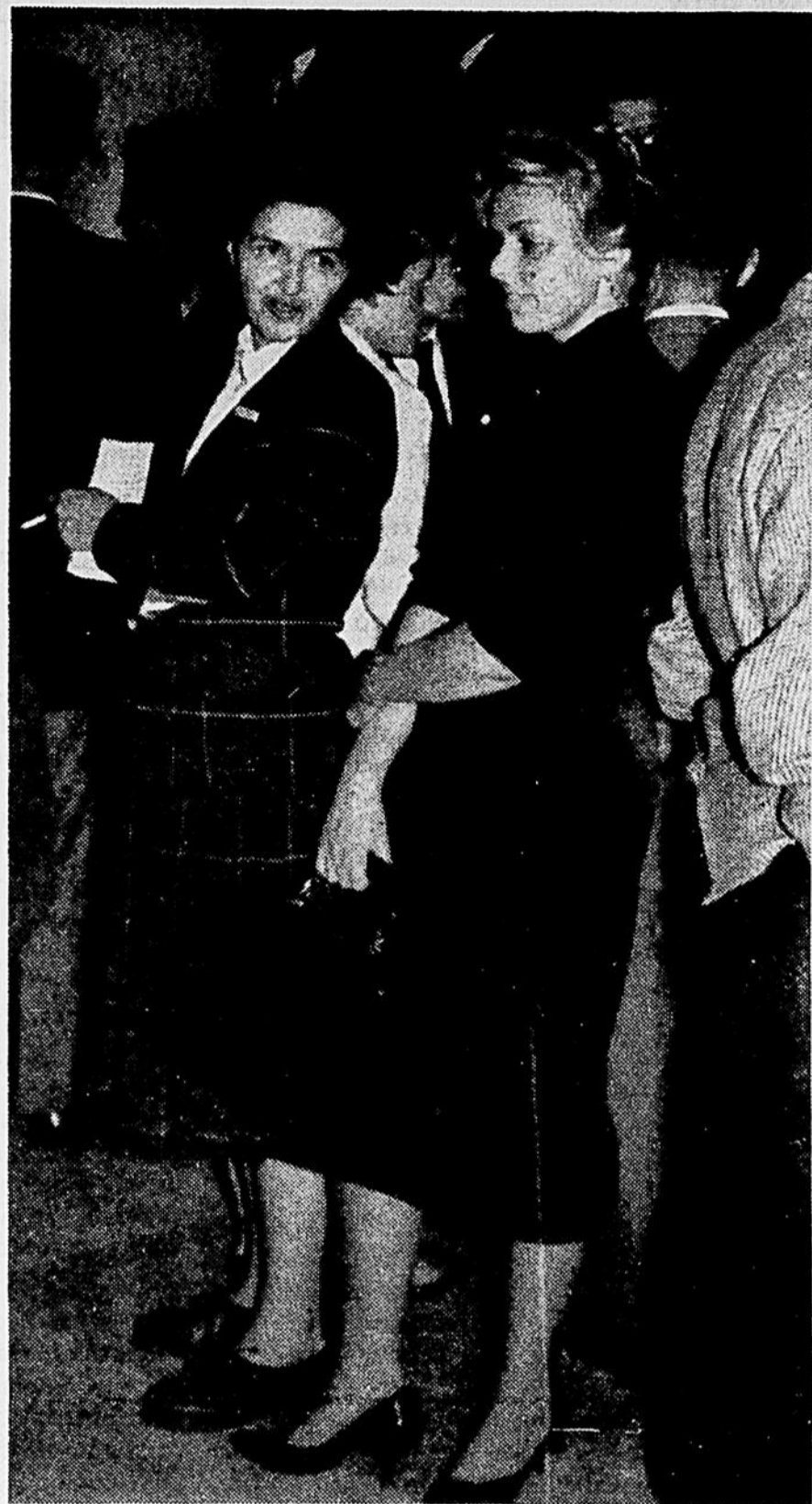
Notre photographe a croqué sur le vif cette jolie inconnue lors d'un récent coquetel de la Faculté de médecine. Aurait-il déjà découvert la future Miss Quartier Latin? L'élection de Miss Quartier Latin se fera, cette année, au suffrage universel. Le règlement de cette élection se trouve en page six de ce numéro.

L'objectif de ce programme est de donner une meilleure formation générale, maintenant de plus en plus nécessaire pour répondre aux besoins de l'étudiant moderne.