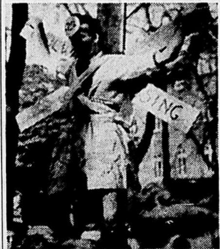
Initiation de jadis: Les mœurs étaient moins raffinées...

de tels "parties" car ils seraient contagieux pour le "campus".