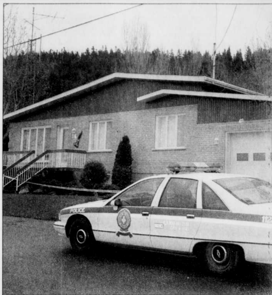
La maison du couple avait été laissée sens dessus dessous par les suspects.

Une rumeur selon laquelle les policiers ont ralenti leurs recherches, faute de budget, est à l'origine de cette pétition. « Nous devions déplacer nos effectifs pour vérifier des éléments qui nous provenaient d'autres sources, précise Jean-Bruno Latour de la SQ. Mais l'enquête n'a jamais cessé, pour