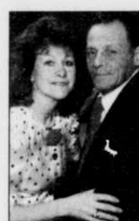
Les deux victimes

Une pétition en ce sens circulera, dès aujourd'hui, dans divers établissements commerciaux du Québec.