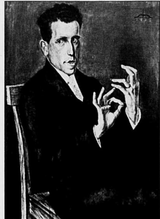
Une oeuvre évaluée à 1,65 million $.