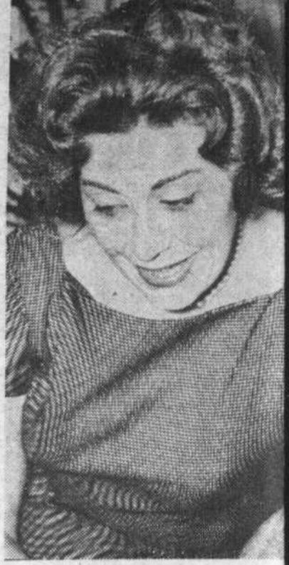
HUGUETTE OLIGNY "Agathe"