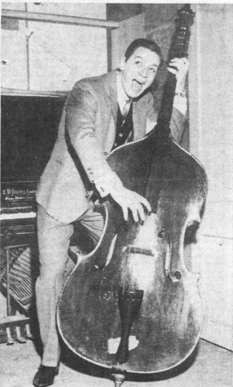
Il joue, à l'occasion, de tous les instruments.