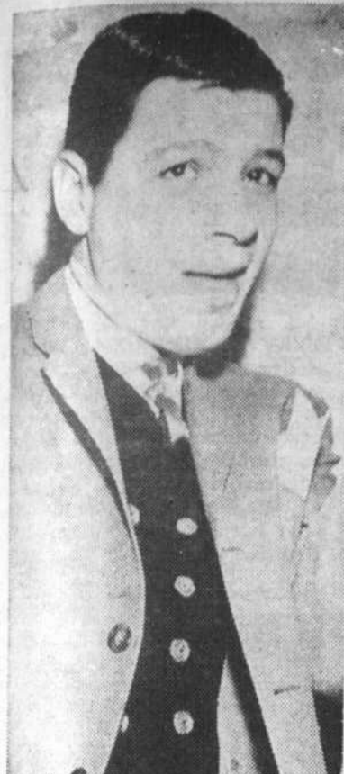
Connu depuis un an... et déjà riche.