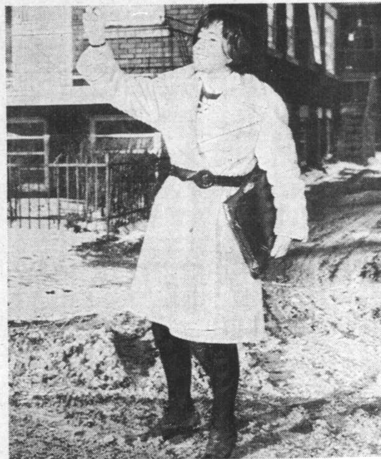
Condamnée au transport en commun (ou aux "lifts").