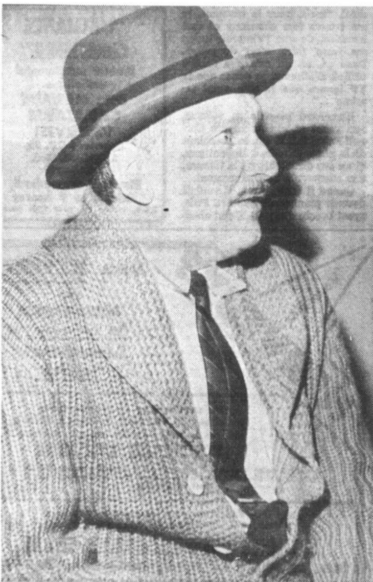
Le populaire Jean Duceppe, travesti en Téphère Dumouchel.

On compare facilement SHIRLEY TEMBLE à CAROLINE KENNEDY lorsque la première avait l'âge de la seconde... Depuis son séjour de quelques semaines dans un hôpital de San Francisco, BING CROSBY se porte aussi bien que le cadet des artistes hollywoodiens.