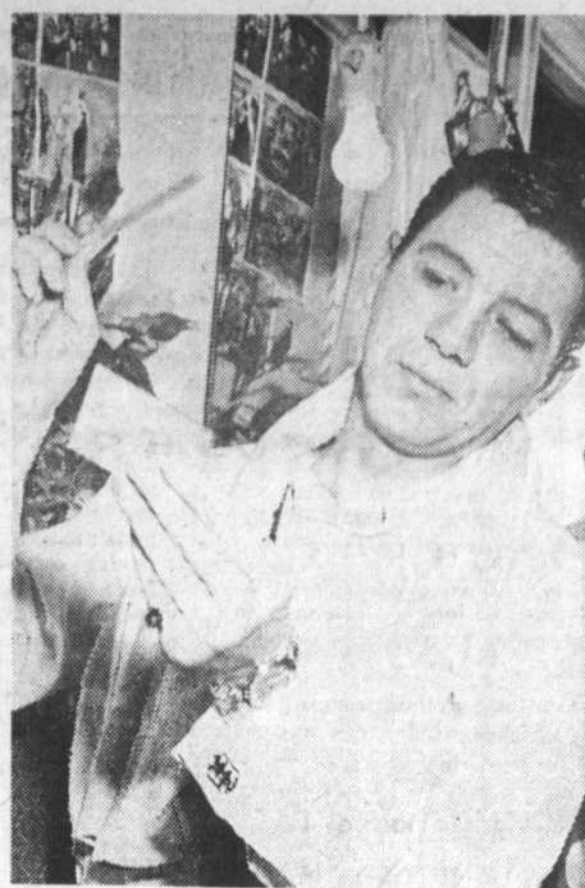
Maintenant vedette, il a droit à sa loge.