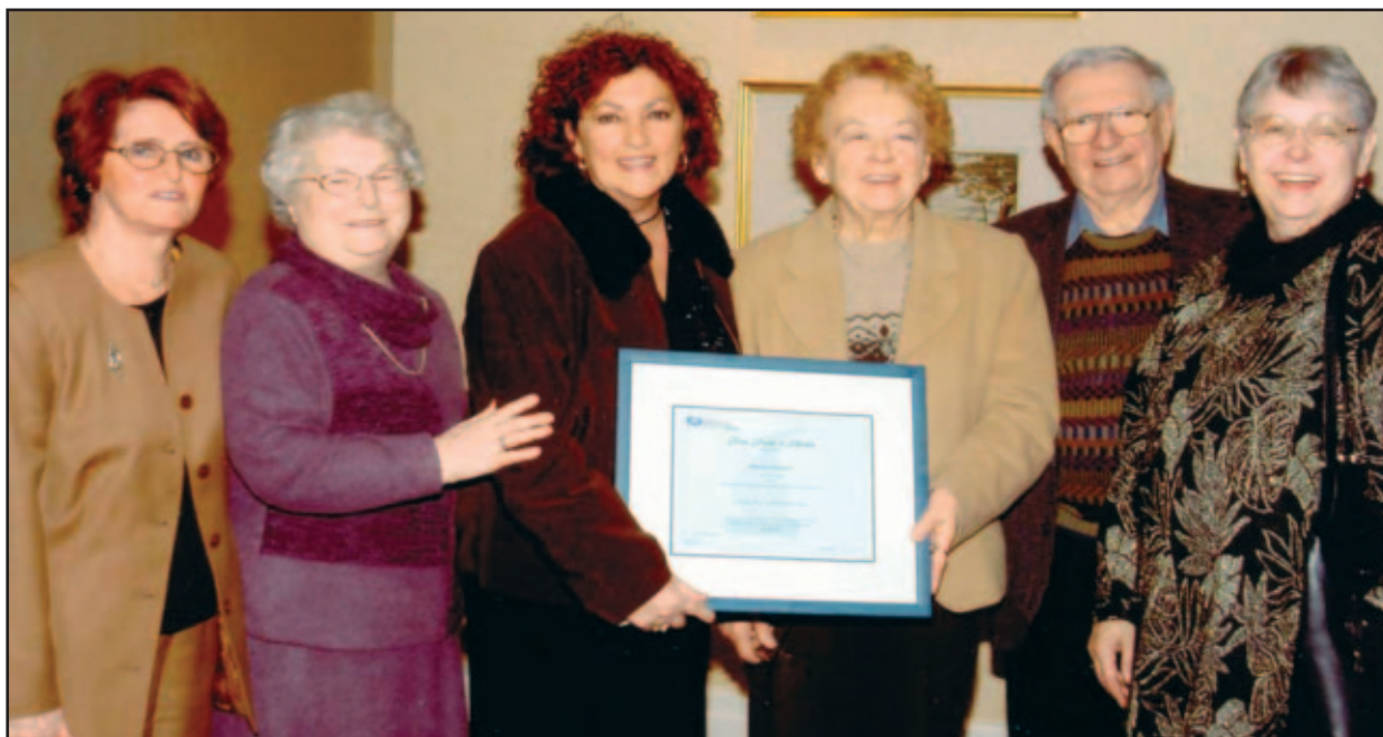
Bravo pour votre travail en prévention des abus et de l'exploitation envers les aînés.

S'appuyant sur une philosophie positive du vieillissement, l'Association québécoise de défense des droits des personnes retraitées et préretraitées (AQDR) DRUMMOND suscite la solidarité, l'entraide et le respect à tout âge.