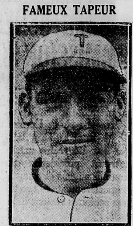
Joe KELLY, fameux frappeur des Toronto Leafs, qui sera probablement vendu aux White Sox.

En ces temps modernes, lorsque vous achetez un billet de chemin de fer assurez-vous d'acheter en même temps un bon service. Vous y avez droit et il ne vous en coûte pas plus cher. En plus de toutes les nécessités, illes qui wagonnets buffets modernes, wagons-salons et wagons-lits, et la courtoisie des employés, le National Canadien offre à ses clients se rendant à Hamilton, Toronto, Détroit et Chicago une route double voie de Toronto à ces endroits. Et le service d'Ottawa à Toronto n'a pas besoin de commentaires pour le voyageur d'expérience. Pour réservations, etc., s'adresser à tout agent du National Canadien. 14, 21, 28 Janv.