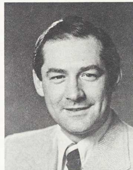
M. Denis DE BELLEVAL, ministre Fonction publique du Québec