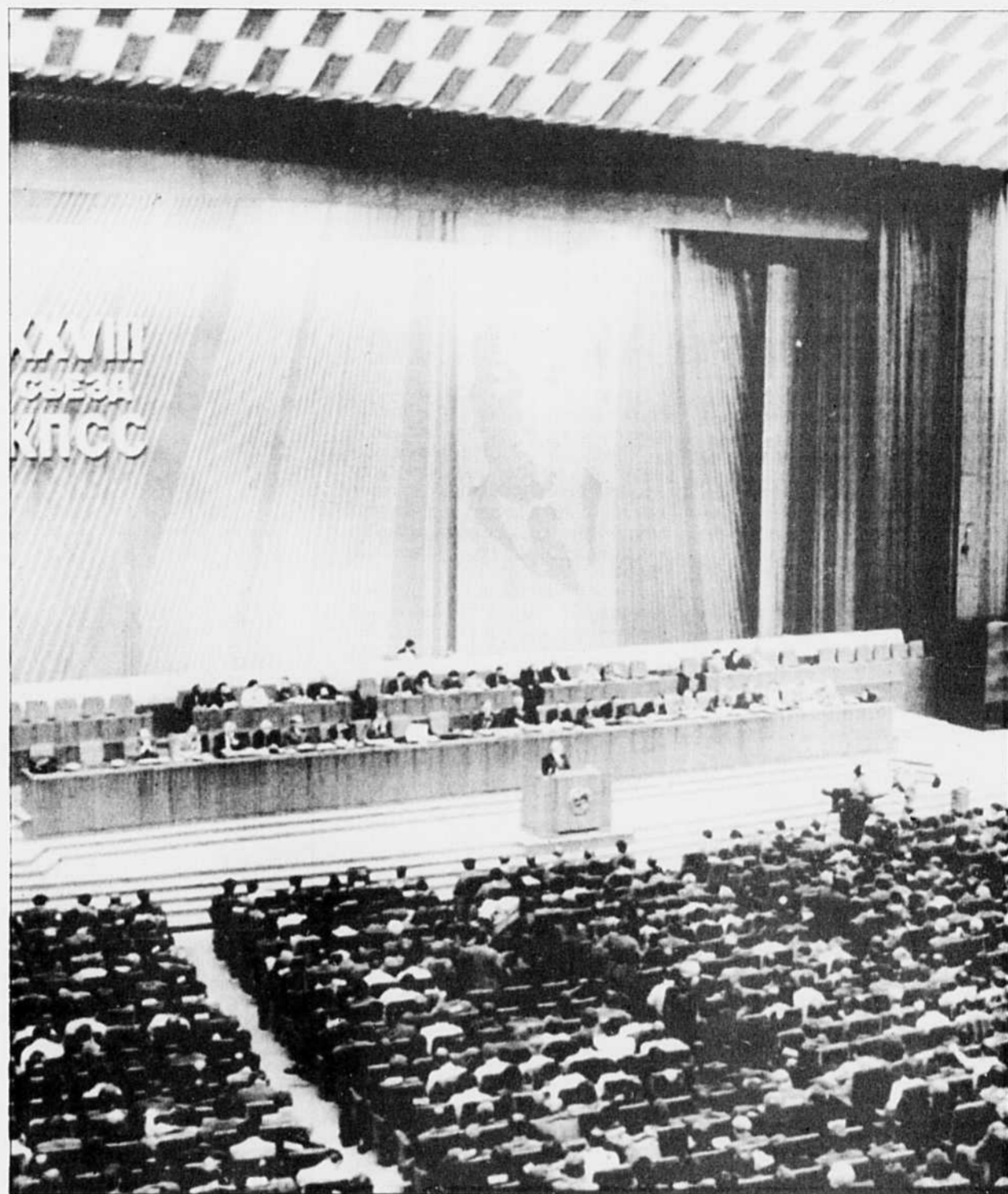
Lors du récent congrès du PCUS, 85 % du Comité central a été renouvelé, un pourcentage sans précédent.

reste en fin de compte la direction politique des forces armées, avec son nouveau chef, le général Chlaga, et plusieurs de ses adjoints, y compris le chef de la direction politique de la garnison d'Erevan, le seul « petit général » qui figure aux côtés de ces gros calibres.