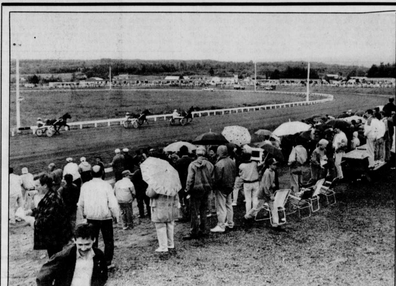
À l'hippodrome de Saint-Aimé-des-Lacs, les gens se retrouvent dans une atmosphère de fête champêtre.

La menace de démission en bloc n'a toutefois par été retournée. Les médecins, forts de l'appui des administrateurs de cet établissement de santé, ont choisi d'agir de la sorte, en avril, « pour forcer les autorités concernées à trouver une solution pour régler le problème de pénurie de médecins » qui frappe régulièrement cet hôpital. Deux mois plus tard, ils accordaient un premier sursis à leur employeur. Ce nouvel ultimatum devait prendre fin demain.