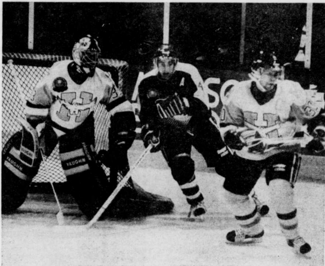
La brigade défensive des Harfangs s'est bien comportée, tenant souvent à distance les joueurs des Cataractes.

NOTES: Les Harfangs n'ont plus qu'un match hors-concours à disputer, soit mardi soir à Rimouski contre les Bisons de Granby... Un seul joueur a endossé l'uniforme pour les sept premiers matchs. Il s'agit de Pierre-André Thibault... Les recrues ont marqué 48 % des buts des Harfangs jusqu'ici... Le Biélorusse Dmitri Goubar n'a pas mis de temps à s'impo-