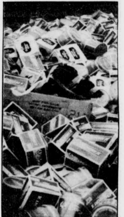
Il n'y a pas que les trafiquants qui sont passibles d'amendes, mais les acheteurs risquent des frais de 200 $ s'ils sont pris en flagrant délit.

De nombreux consommateurs font quand même preuve de prudence, en se procurant des étuis à cigarettes, ce qui évite de se balader avec un paquet sur lequel il est inscrit « vente interdite au Canada ». La plupart des endroits où se vendent des cigarettes de contrebande vendent aussi des étuis, a-t-on pu constater lors d'une tournée de magasinage hier.