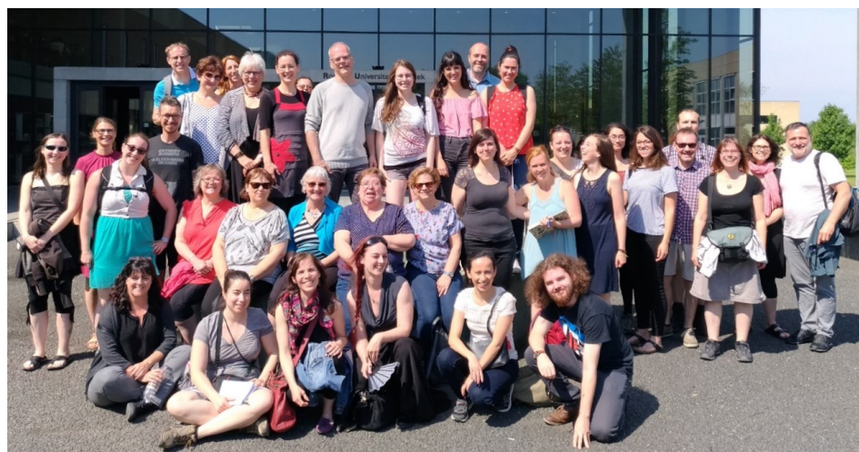
Le groupe devant la bibliothèque de l'Université de Roskilde.

Infos, photos et vidéos sur la page Facebook du groupe : www.facebook.com/groups/108105099964276/