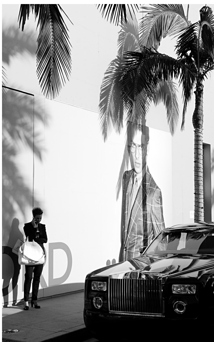
La chic Rodeo Drive, quintessence de l'avenue griffée.

L'inauguration, en 2003, du brindezingue Walt Disney Concert Hall n'est certes pas étrangère à ce renouveau: voisin du pertinent Musée d'art contemporain et conçu par Frank Gehry, il s'inspire du musée Guggenheim de Bilbao, une ville qui a connu une digne renaissance après l'implantation de l'icône architecturale.