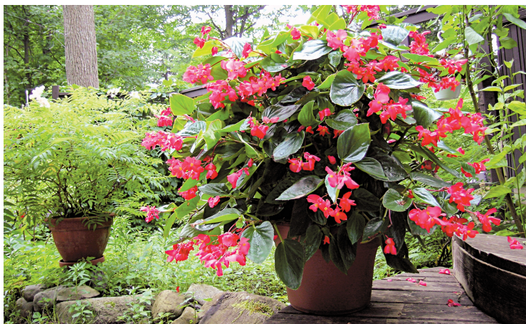
Solide, superbe, indispensable bégonia «Dragon Wing»

Les fleurs tombent d'elles-mêmes, donc pas besoin de les couper