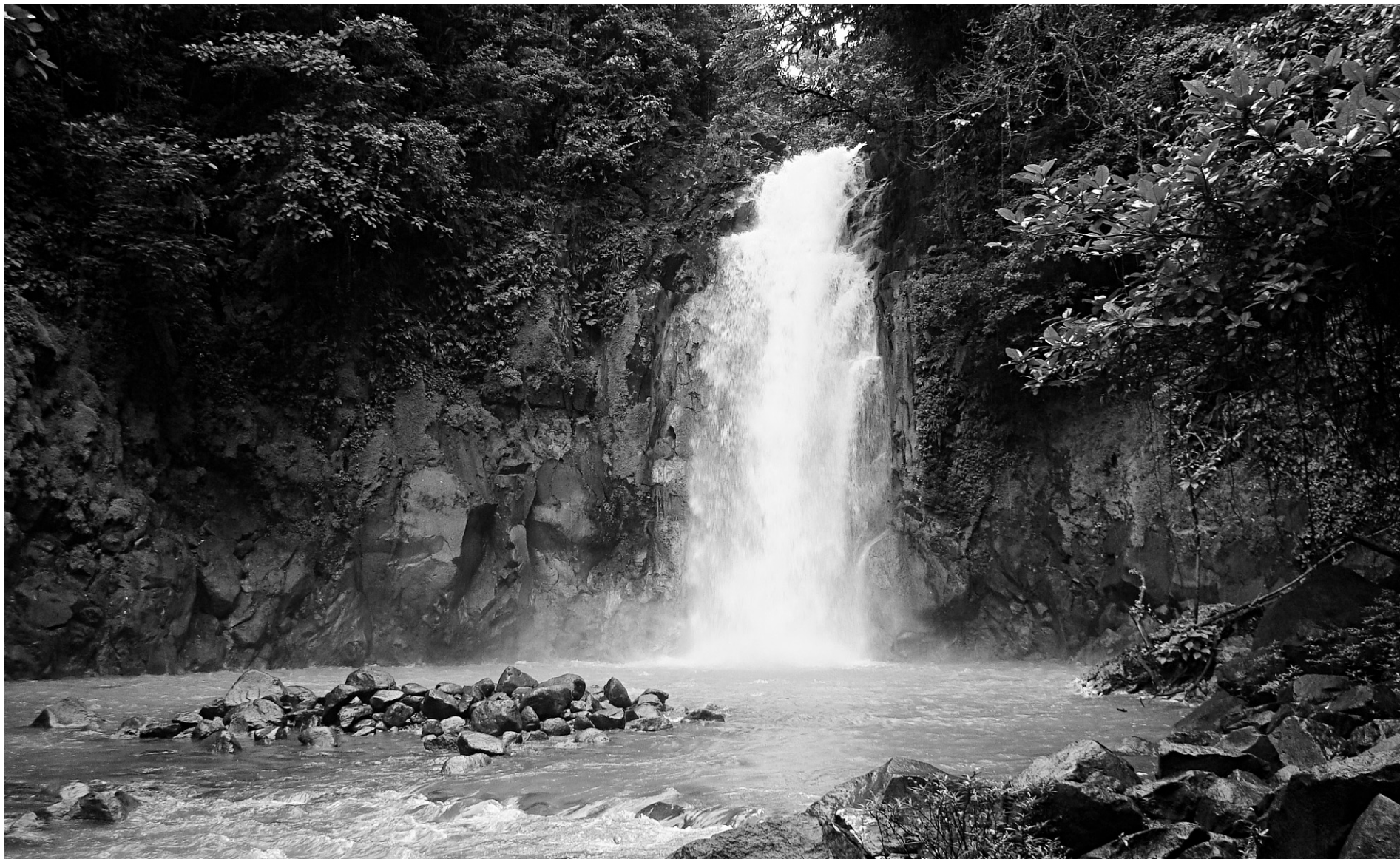
Une rivière turquoise du parc national du volcan Tenorio, au Costa Rica, dont l'eau tire sa couleur de la réaction chimique entre le gaz sulfurique et le carbonate de calcium.

Si vous voulez passer une semaine à traverser les régions de la côte atlantique irlandaise, la plus belle excursion se fait à dos de cheval à travers les montagnes de Slieve Aughty, le parc national de Burren, les îles Aran et les dérivations de la Shannon. L'hébergement proposé garantit un accueil chaleureux à travers fermes, pubs et guest-houses d'un autre siècle... Les groupes ne dépassent jamais 10 personnes. Avoine, bière et petits déjeuners compris. Prévoir au moins 640 $ pour la semaine en équitation double. Pour les non-initiés, on se fait des trajets différents dans les mêmes régions en vélo ou à pied... Les meilleures saisons pour un climat serein sont en juin ou en septembre. Si vous voulez vraiment faire copain copain avec l'équidé irlandais, il existe également des formules avec carrioles and déjeuner. Votre carriole est équipée d'un