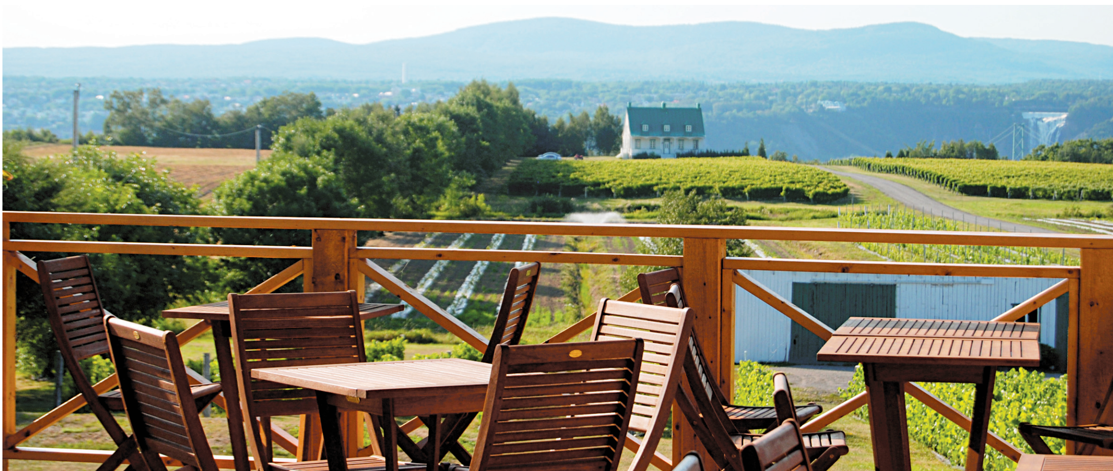
La terrasse offre une vue sur le vignoble de Louis Denault et Nathalie Lane à Sainte-Pétronille, sur l'île d'Orléans.