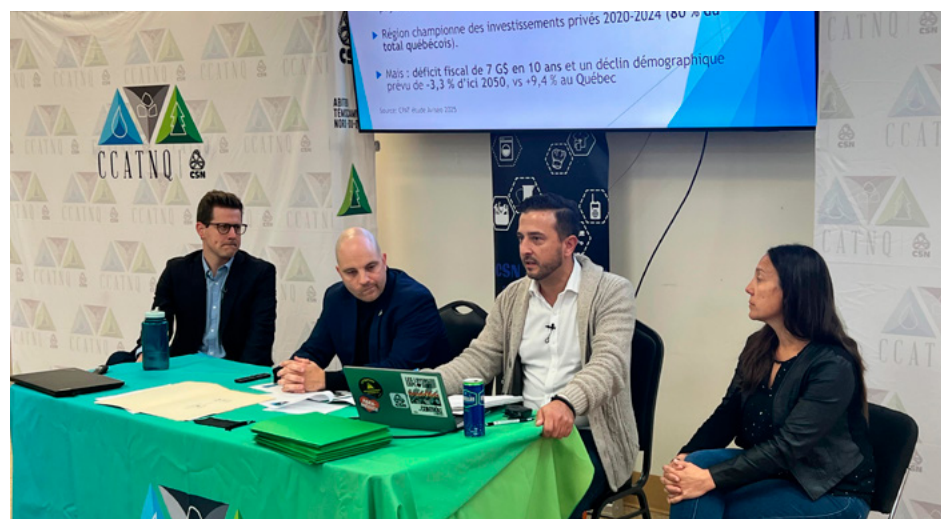
Navettage en Abitibi, les syndicats tirent la sonnette d'alarme