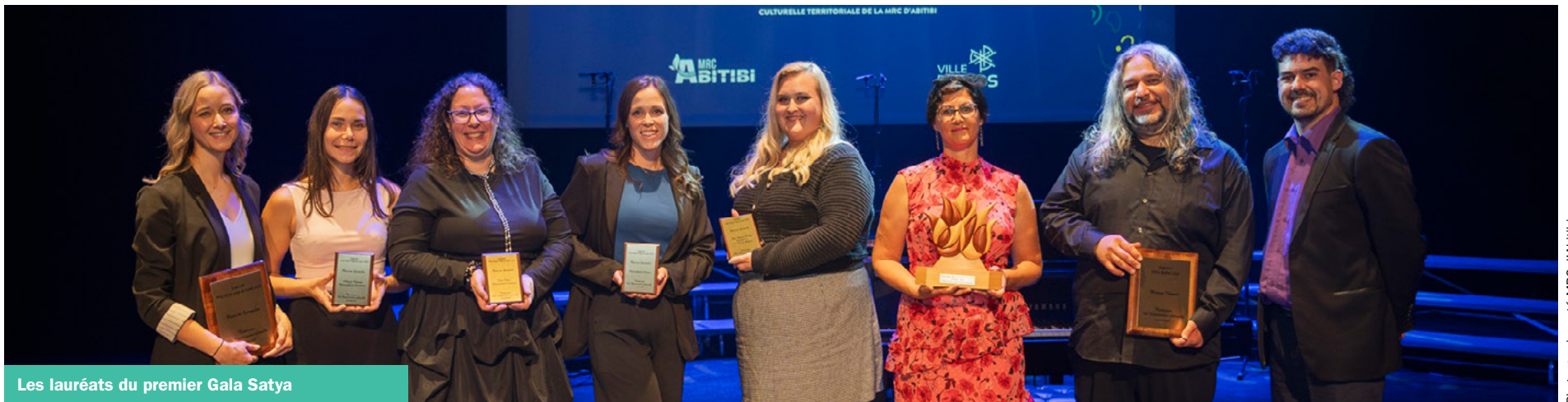
Les lauréats du premier Gala Satya

Avec cette nouvelle mouture, le Gala culturel Les Satya s'impose déjà comme un rendez-vous incontournable pour célébrer les artistes, les créateurs et les initiatives qui font vivre la culture sur le territoire. La soirée a démontré la pertinence d'un tel événement et l'attachement du public envers ses talents locaux.