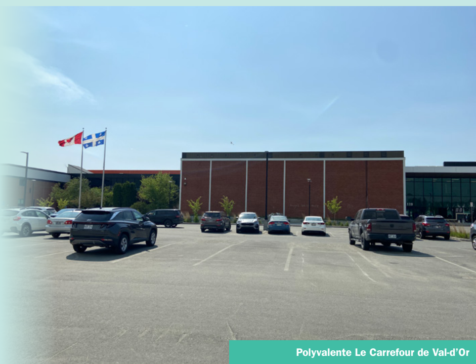
Polyvalente Le Carrefour de Val-d'Or

Un appel à la population est en cours pour enjoindre les victimes à s'inscrire à l'action collective d'ici le 23 novembre 2025. Les victimes sont invitées à présenter une demande d'indemnisation avant la date limite. Rappelons que le rapport d'autorité entre un professeur et ses élèves rend tout consentement impossible. Le processus d'indemnisation, mis en œuvre par le cabinet Lapointe Légal, est confidentiel et gratuit. Les victimes, leurs héritiers ou ayants droit, doivent déposer une demande avant le 23 novembre 2025 en contactant le cabinet. Les victimes ne s'étant pas manifestées avant cette date perdront leur droit de poursuivre ou d'obtenir compensation, et ce, de façon définitive. Pour être admissibles, les membres doivent avoir fréquenté la Polyvalente Le Carrefour dans les années visées par l'action collective. Pour contacter le cabinet : actioncollective@lapointelegale.ca ou 514-688-9169.