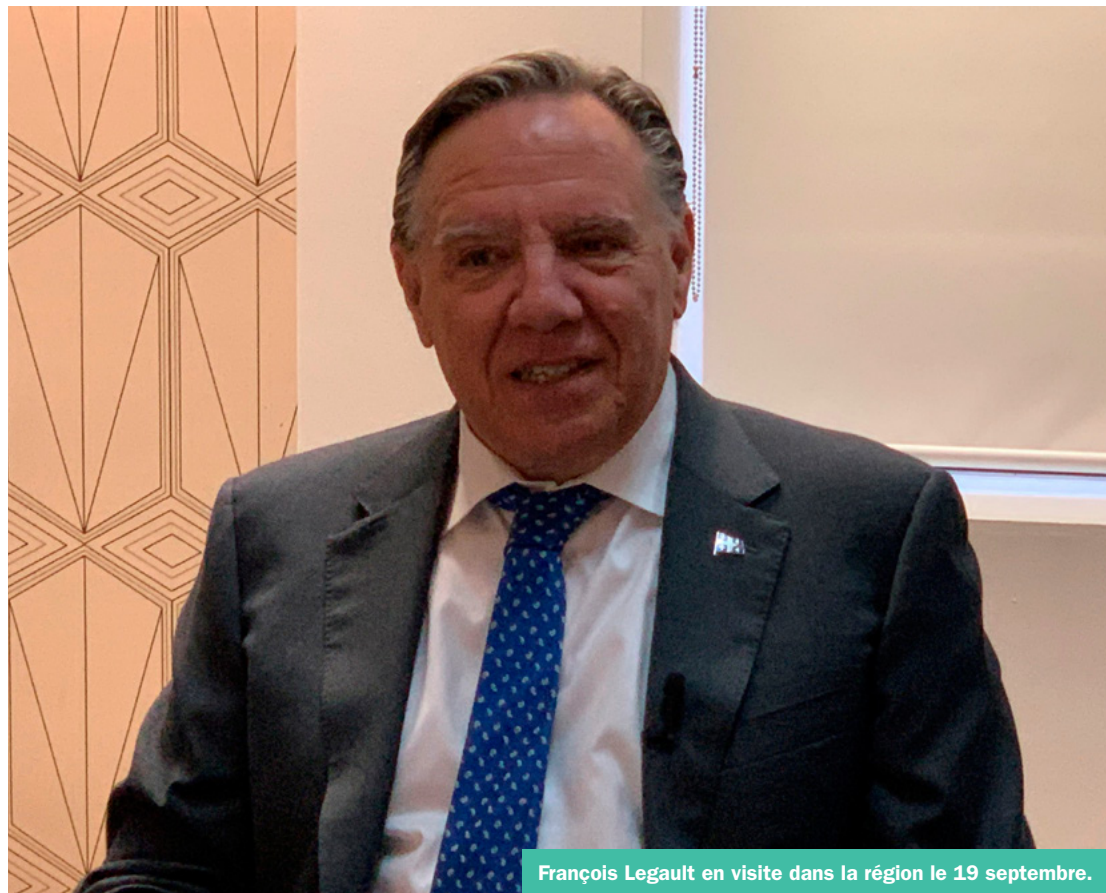
François Legault en visite dans la région le 19 septembre.

Concernant Sayona Mining, la Coalition évoque à la fois les risques pour la qualité de l'eau des eskers et la fragilité financière de l'entreprise, qu'elle considère comme un argument suffisant pour écarter tout soutien énergétique ou financier supplémentaire.