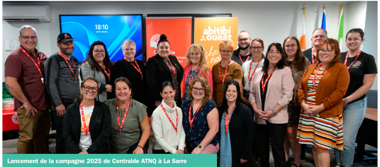
Lancement de la campagne 2025 de Centraide ATNQ à La Sarre