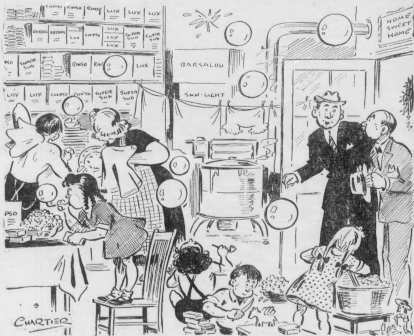
"Ma femme raffole tellement de tous les sketches radiophoniques qu'elle n'épargne rien pour encourager les commanditaires."