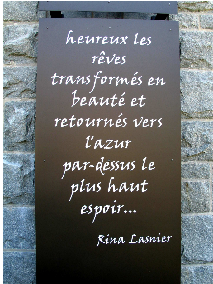
Plaque commémorative sur le mur extérieur de la Bibliothèque Rina-Lasnier.