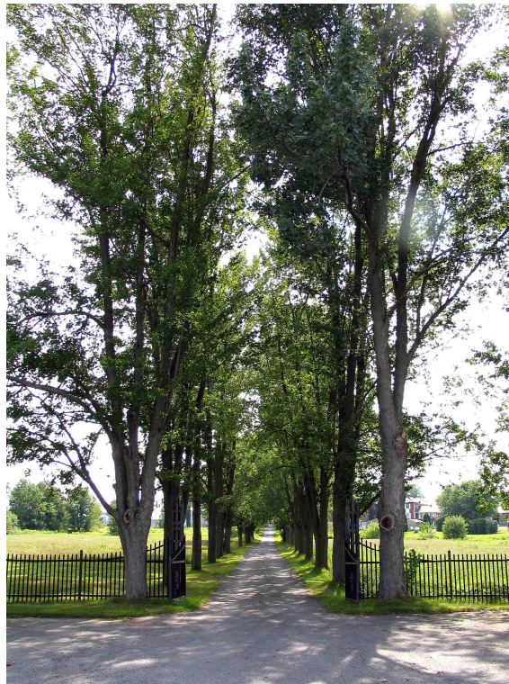
Sortie du cimetière (1905) à Saint-Jacques