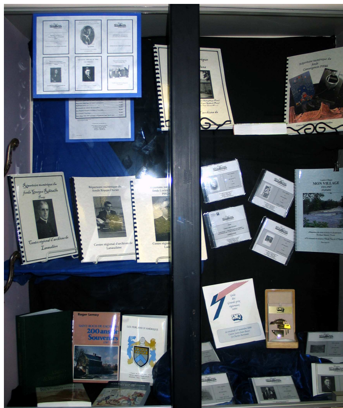
Exposition de livres et de documents au Centre régional d'archives de Lanaudière à L'Assomption. On y retrouve entre autres le fonds Louis-Joseph-Doucet et le fonds Réjean-Olivier.