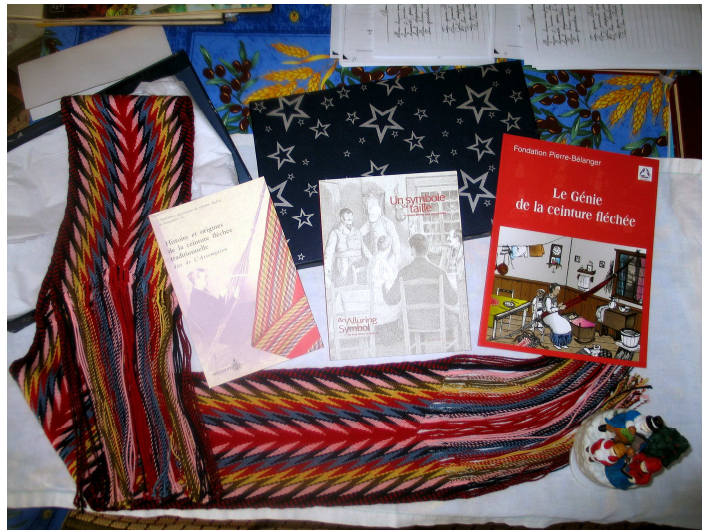
Pièce de fléché par France Hervieux, artisane lanadoise, et quelques livres sur le sujet (Photo : Réjean Olivier, Joliette, 2007)