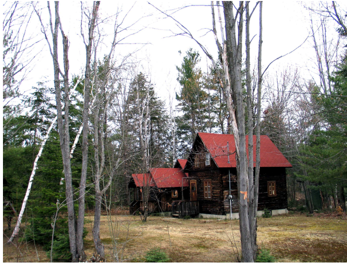
Presbytère de l'église orthodoxe Saint-Seraphim-de-Sarov (Rawdon)