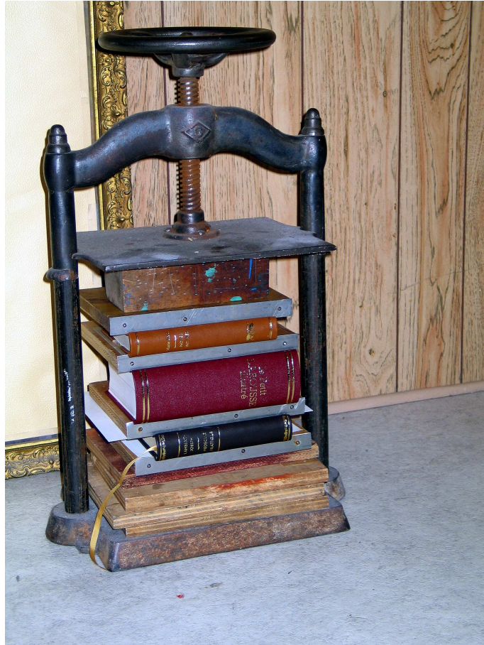
Livres sous presse chez Louis Grypinich, relieur d'art joliettain