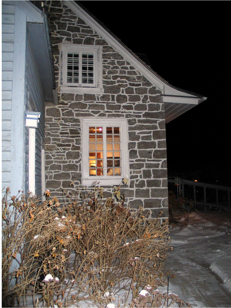
La Maison Antoine-Lacombe, Rang Visitation, Saint-Charles-Borromée