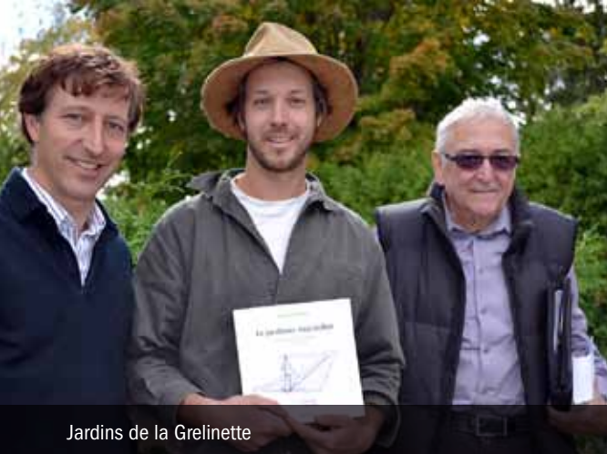
Jardins de la Grelinette