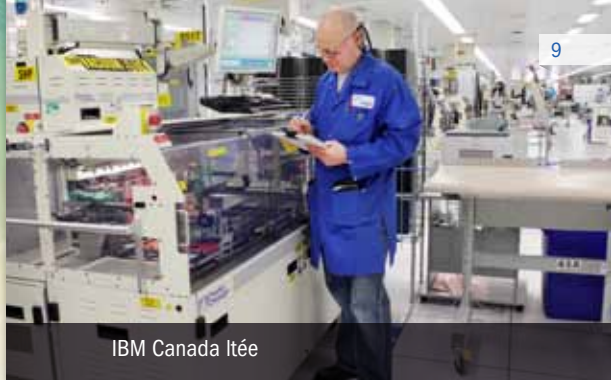
IBM Canada Itée