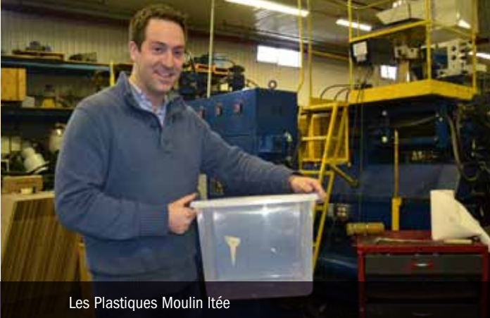
Les Plastiques Moulin Itée