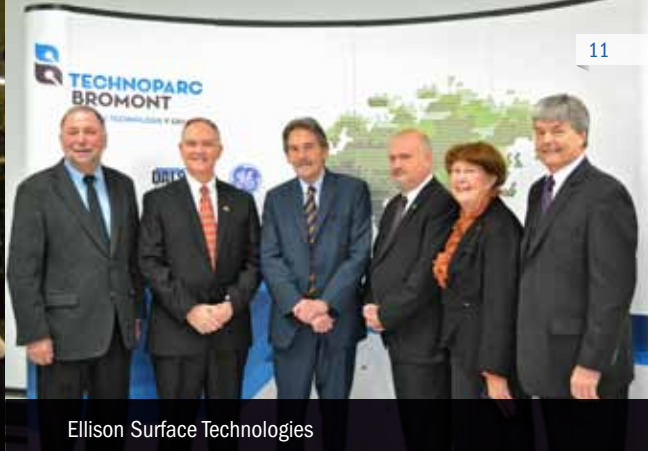
Ellison Surface Technologies