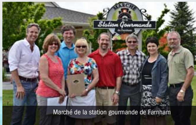
Marché de la station gourmande de Farnham