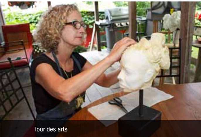
Tour des arts