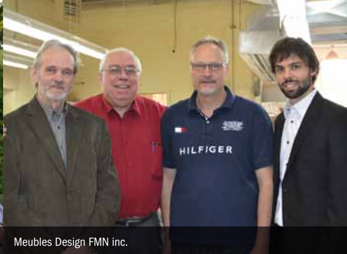
Meubles Design FMN inc.