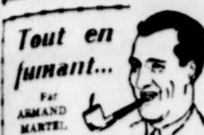
Tout en fumant... par ARMAND MARTEL