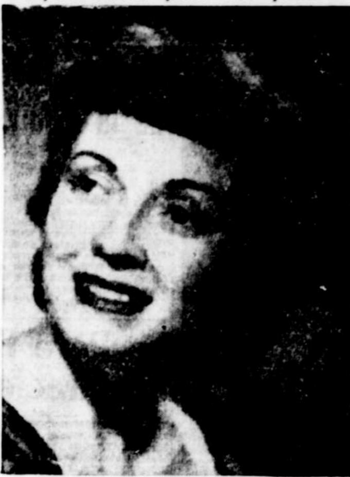
(Par Helen Fuller)