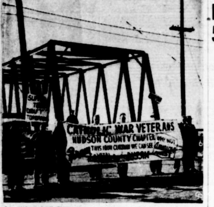
Les vétérans catholiques du comté d'Hudson, N.J., se rappellent que les Etats-Unis ont contribué à armer le Japon avant le coup de Pearl Harbor. Ils se rappellent aussi que les Alliés d'Amérique ont approvisionné l'Allemagne et l'Italie avant l'invasion de la Pologne. Ils protestent ici contre l'envoi d'armes des Etats-Unis à la Russie, et leur protestation sera beaucoup plus vigoureuse, dans quelques heures, Washington annonce de la part du président Truman l'interdiction de l'exportation en Russie de matériel qui pourrait servir dans une guerre contre les Etats-Unis.