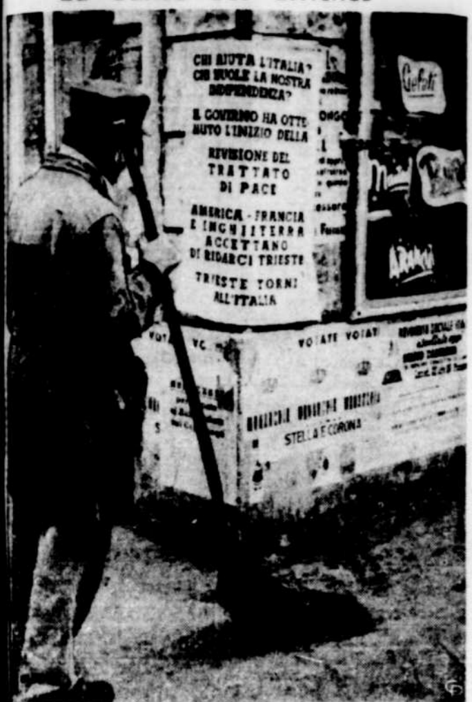
Un ballot de rue d'Italie a déposé son arme pour se reposer en lisant les dernières affiches électorales collées sur les murs. La plus récente de la série parait du retour de Trieste à l'Italie, pour laquelle on consenti la France, l'Angleterre et les Etats-Unis.