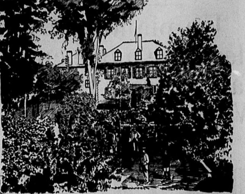
LE PLUS COMPLET DANS LA PUISSANCE DU CANADA

Et il y a cet immense avantage des premiers sur les derniers, c'est qu'ils coûteront infiniment moins cher. Au lieu du subsidé statuaire de $3,200 par mille, accordé aux chemins de fer, un simple subsidé, disons de $1,000 par mille, suffirait à l'établissement d'excellentes voies carrossables.