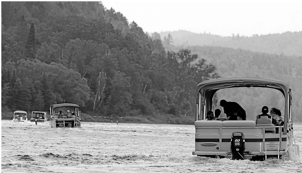
Les visiteurs ont été nombreux à la marina de La Tuque depuis le début de la saison 2017.

«On a remarqué qu'il y avait de plus en plus de Latuquois. Ce n'est pas seulement des gens de