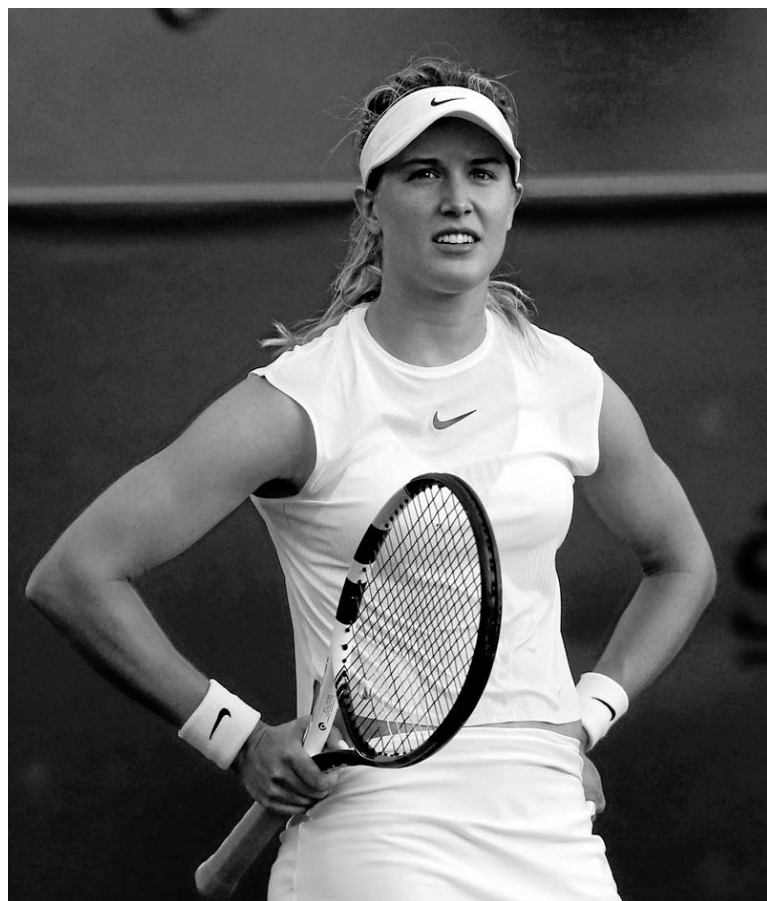
Eugenie Bouchard a été éliminée au deuxième tour du tournoi de Washington.