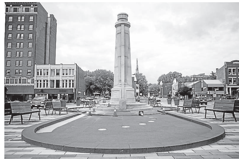
Les jets d'eau seront de retour à la place Pierre-Boucher alors que la Ville de Trois-Rivières s'est vu confirmer que la légionellose ne provenait pas de ses fontaines.

Une deuxième analyse vient donc de confirmer cette information.