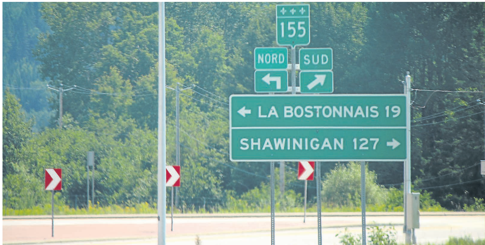
La téléphonie cellulaire sur la route 155 était au cœur d'une rencontre avec la firme Solutions Ambra.

«On dépend de subventions additionnelles pour l'opération de