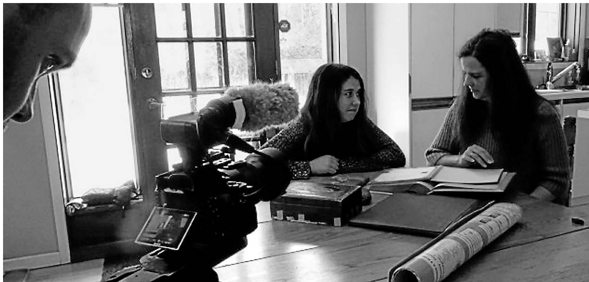
La qualité exceptionnelle du documentaire «Cédrika» fait dire à l'auteur de ce texte qu'il est nécessaire de tenir à nos médias régionaux.

La première leçon, je la tire en constatant l'immense générosité des voisins, mais aussi de toute une population régionale qui ne demandait qu'à aider et à appuyer la famille éplorée. Il était frappant de constater la quantité de gens prêts à donner du temps et à offrir leur disponibilité pour aider à retrouver Cédrika. Les gens l'ont