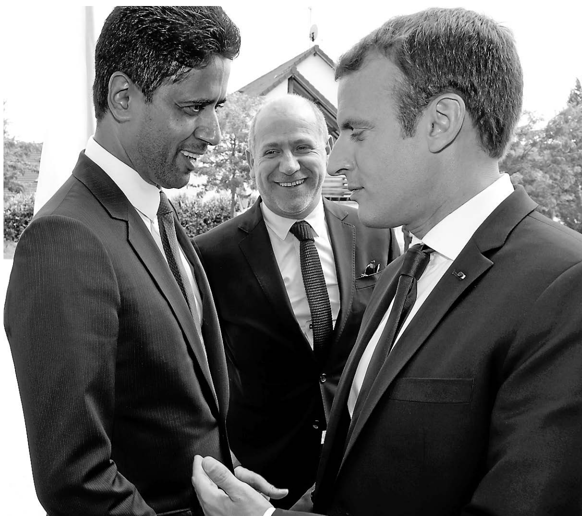
Lors d'un événement caritatif, le président français Emmanuel Macron (à droite) a rencontré le président du Paris Saint-Germain, Nasser Al-Khalaifi, et lui a offert ses félicitations puisqu'il disait avoir «appris une bonne nouvelle» en faisant référence au transfert de la vedette Neymar.

Neymar avait mis fin à des semaines de mutisme, mercredi, en annonçant aux dirigeants du FC Barcelone, aux joueurs et à l'entraîneur qu'il avait l'intention de quitter l'équipe après y avoir