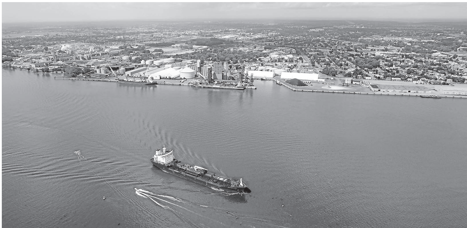
L'économie de Trois-Rivières affiche une belle vigueur avec, entre autres, le développement du port et les investissements chez Kruger.

Les entreprises locales, fonctionnant pratiquement au maximum de leurs capacités, ont réagi à la hausse de la demande de leurs produits en investissant dans l'agrandissement ou la rénovation de leurs usines, ainsi que dans de nouvelles technologies visant à automatiser la production ou à augmenter la