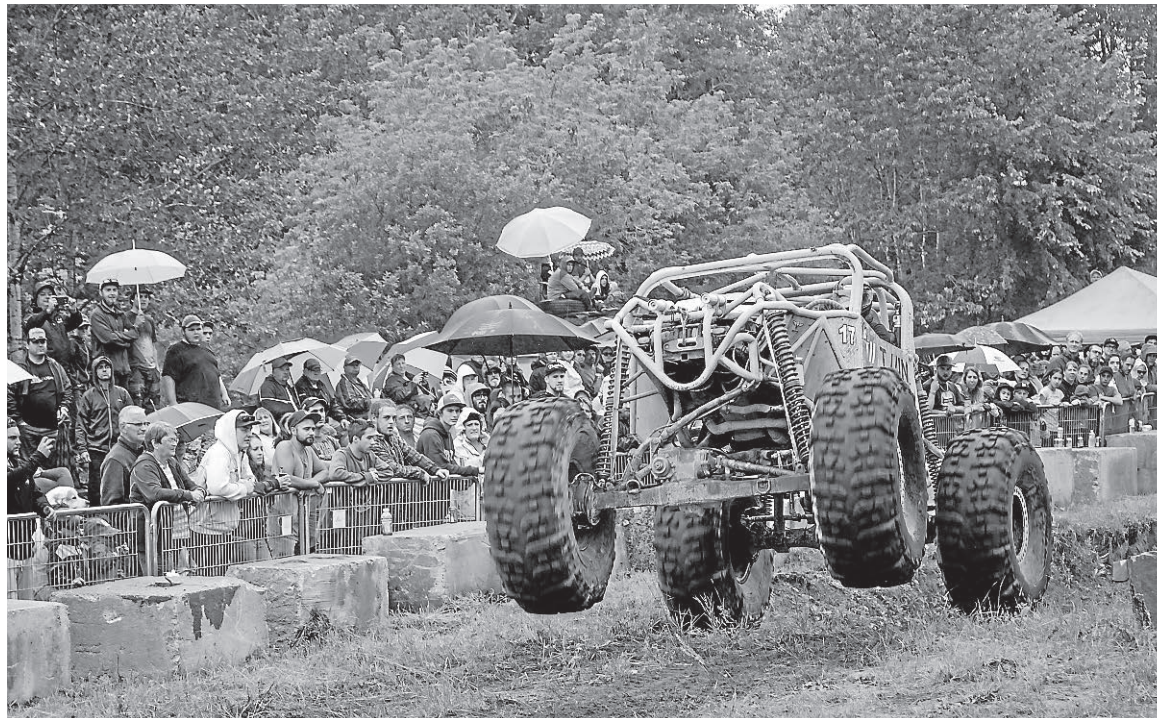
Plusieurs compétitions se dérouleront les 12 et 13 août, dans le cadre de la 12 e édition du NDA Jam de Notre-Dame-de-Montauban.

Les amateurs de sensations fortes seront comblés le samedi, avec le parcours en montagne de la classe «kamikaze», en plus de l'incontournable compétition amateur de 4x4 «Mud Drag». En après-midi, des spectacles de drift et Smoke'n'show seront au rendez-vous.