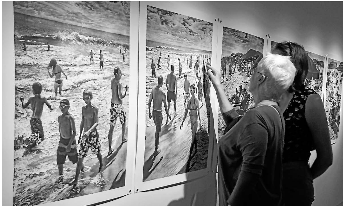
La Biennale d'estampe contemporaine de Trois-Rivières présente plusieurs expositions jusqu'au 10 septembre. Cette photo a été prise au Centre d'exposition Raymond-Lasnier.

Le dimanche 6 août, l'événement familial En chair et en bois: Une impression d'été se tiendra à l'Université du Québec à Trois-Rivières dès 11 h. Des étudiants en arts de l'UQTR et de l'Université Concordia, accompagnés de leurs professeurs, procéderont à une démonstration de la forme d'art qu'ils maîtrisent. Ils graveront une création et l'imprimeront au rouleau compresseur.