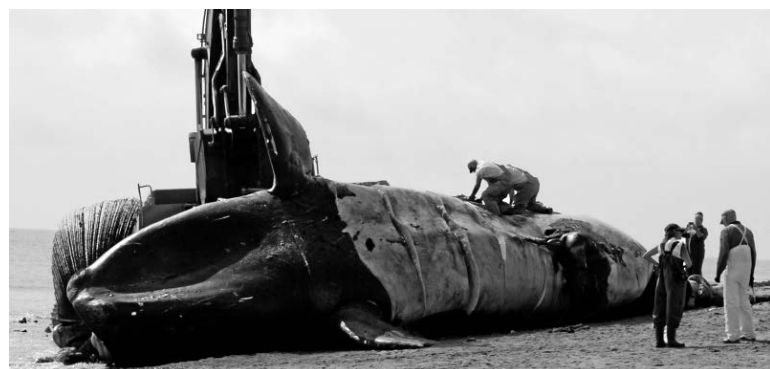
Une huitième baleine noire a été trouvée morte dans les eaux du golfe du Saint-Laurent. Le mammifère géant est en voie d'extinction. Il n'en resterait qu'environ 500 dans le monde.

Le ministre a survolé jeudi matin un secteur à l'est de l'île de Miscou, au large du Nouveau-Brunswick, et y a vu un groupe d'une quinzaine de baleines