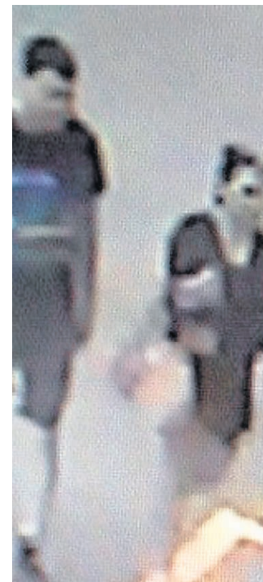
Une fois entré dans la quincaillerie, c'est la femme qui se serait emparée de la perceuse.

La femme mesurerait environ 1,65 mètre (5pi 5po). Ses cheveux seraient de couleur brun foncé ou noir. Lors du méfait, elle portait une jupe noire et une veste noire.