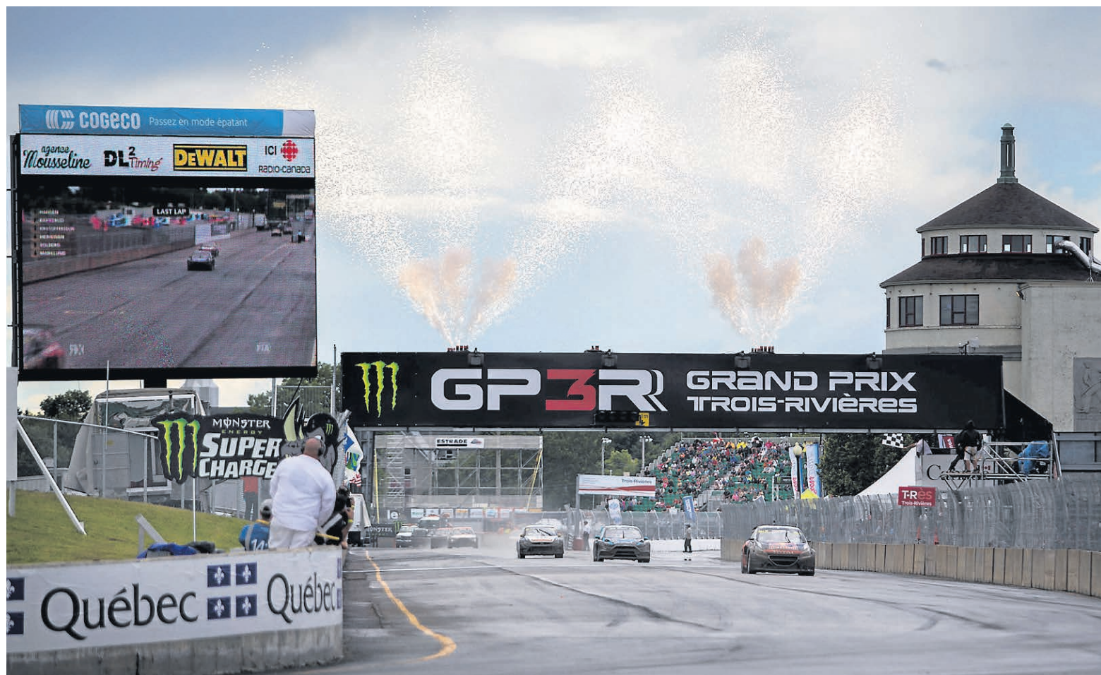
Les voitures de rallycross, qui valent des centaines de milliers de dollars, animeront la première fin de semaine des courses au Grand Prix de Trois-Rivières à compter de samedi. Le centre-ville s'anima dès vendredi soir, avec la parade sur la rue des Forges.

NÉCROLOGIE: 819 378-8363 necrologie@lenouvelliste.qc.ca