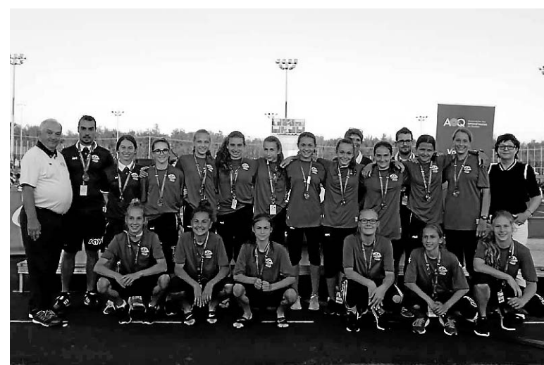
Les deux équipes de la région ont loupé de peu le championnat de la division 2, en fin de semaine lors des Sélections régionales chez les moins de 13 ans.