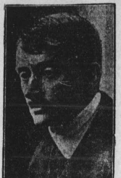
JOHN MASEFIELD, le nouveau Poète Lauréat de l'Angleterre; ses oeuvres les mieux connues sont Dauber, The Evening Mercy et Sard Harker, celle-ci un roman.