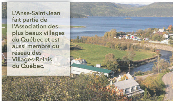
Anse Saint-Jean

L'Anse-Saint-Jean fait partie de l'Association des plus beaux villages du Québec et est aussi membre du réseau des Villages-Relais du Québec.