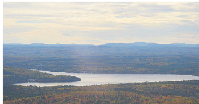
Lac Otis