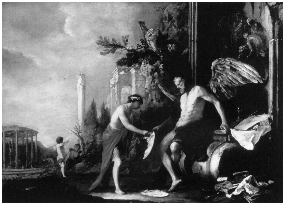
«Allégorie du temps (Cronos et Eros)», 1630-1640, par Johann Heinrich Schönfeld

« Nicht ist es aber Die Zeit. Noch sind sie Unangebunden Göttliches trifft unteilnehmende nicht. » 1