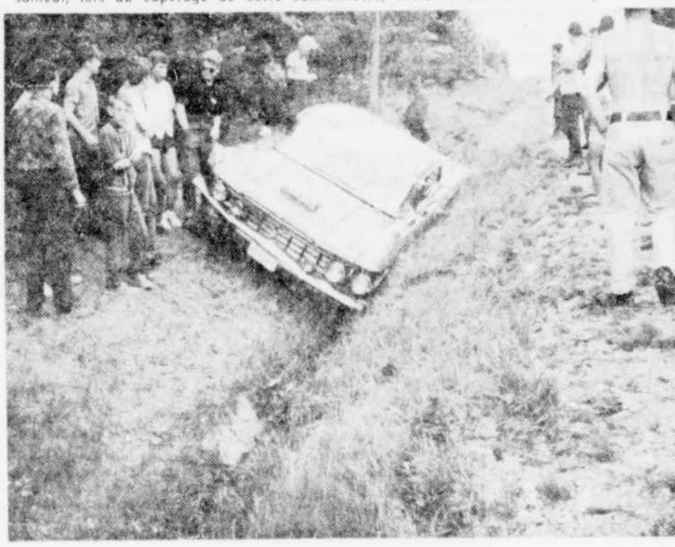
Un automobiliste a dû plonger dans le fossé pour éviter d'entrer dans la foule de curieux qui obstruaient la route.