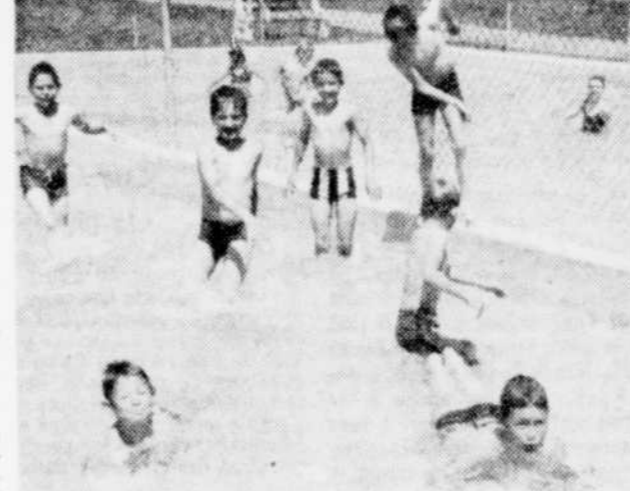
A L'EAU — Les jeunes de Granby peuvent se rafraîchir depuis hier, en se rendant aux piscines municipales. Plusieurs garçons et fillettes ont profité de la belle température d'hier pour être les premiers à utiliser les piscines, tel qu'on peut le voir ci-haut alors qu'un groupe de jeunes se rafraîchissent dans la barboteuse du parc Avery.

Quant aux barboteuses, elles seront également ouvertes à tous les après-midi et en début de soirée, mais les heures définitives ne seront communiquées que plus tard.