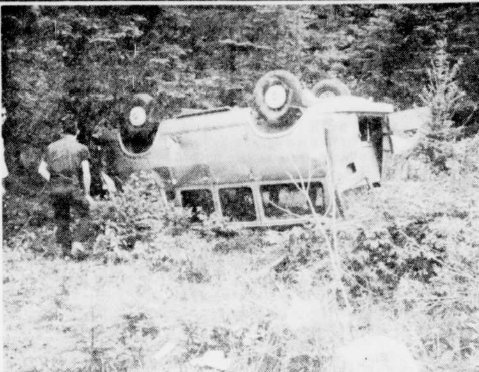
Cinq Sherbrookois, membres de la communauté des Frères de St-Paul, ont été blessés samedi, lors du capotage de cette camionnette, entre Nantes et Stornoway.