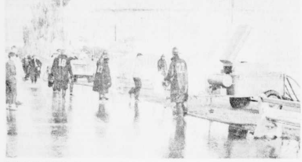
LES POMPIERS du département des incendies de la cité de Magog seront dotés prochainement d'un équipement des plus modernes pour combattre les incendies. Sur la photo, ils sont à l'oeuvre lors d'une pratique qui a lieu à la hauteur de la Promenade Memphremagog. A l'arrière plan, les comions.