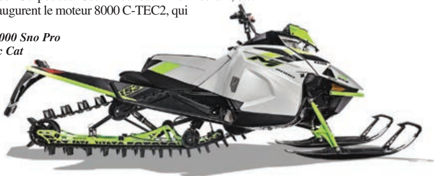
La M 8000 Sno Pro d'Arctic Cat

La M 8000 Sno Pro repose sur la nouvelle plateforme Ascender, dont les marchepieds étroits favorisent une position de conduite plus ergonomique. De plus, le repositionnement de certaines composantes mécaniques améliore la maniabilité dans la poudreuse. Quant à la ZR 8000 Sno Pro ES, elle est pourvue de panneaux de carrosserie de prochaine génération et d'un tableau de bord de luxe permettant 14 lectures différentes: odomètre, indicateur de vitesse, compte-tours, indicateur d'huile, voltage de la batterie, niveau de carburant, etc.