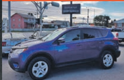
TOYOTA RAV 4 2014

KM : 73 275 km TR : Boîte automatique Prix: 20 995 $ - 1 000 $