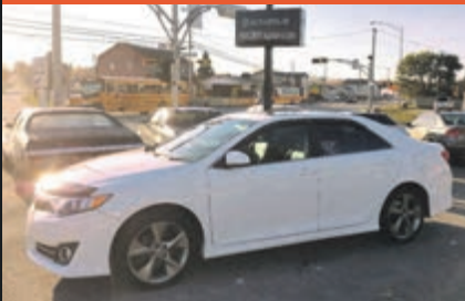
TOYOTA CAMRY 2012

KM : 70 453 km TR : Boîte automatique Prix: 15 995 $ - 1 000 $