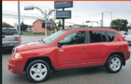
JEEP COMPASS 2010

KM : 75 000 km TR : Boîte automatique Prix: 8 995 $ - 1 000 $