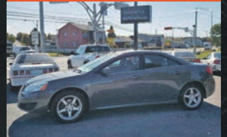
PONTIAC G6 2009

KM : 9 960 km TR : Boîte automatique Prix: 6 995 $ - 1 000 $