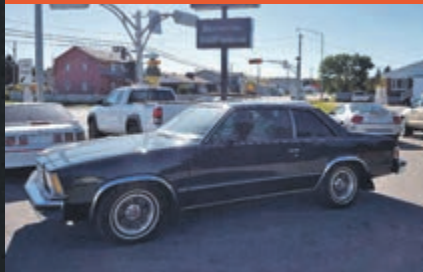
CHEVROLET CHEVELLE 1979

KM : 93 711 km TR : Boîte automatique Prix: 7 995 $ - 1 000 $