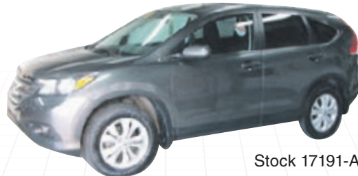
HONDA CR-V EX