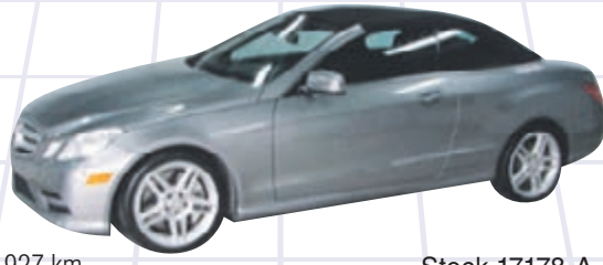
MERCEDES-BENZ E-CLASS 550 2013

- 76 927 km - Boîte automatique avec mode manuel