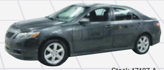
TOYOTA CAMRY SE 2009