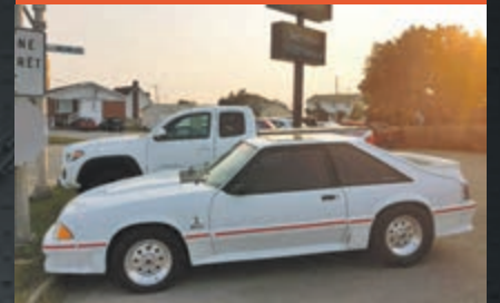
FORD MUSTANG 1990

KM : 21 837 km TR : Boîte manuelle Prix: 8 995 $ - 1 000 $