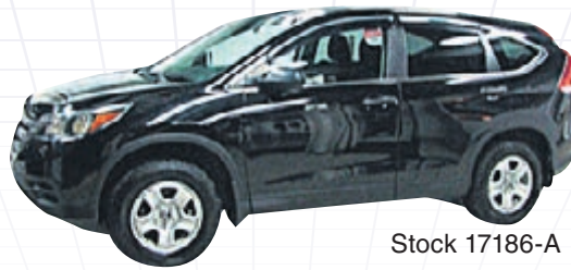
HONDA CR-V LX AWD 2014