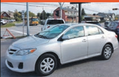
TOYOTA COROLLA 2012

KM : 87 000 km TR : Boîte automatique Prix: 9 995 $ - 1 000 $