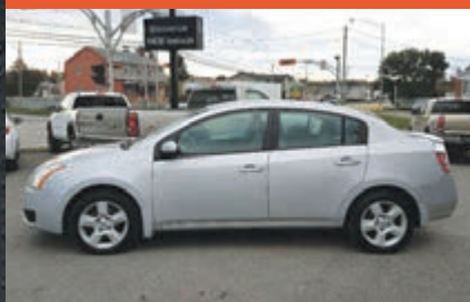
NISSAN SENTRA 2007

KM : 139 600 km TR : Boîte automatique Prix: 5 995 $ - 1 000 $