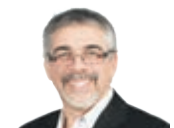
ALAIN MORIN guideautoweb.com

Après des mois d'attente, c'est fait! Jeep vient d'annoncer officiellement la prochaine génération de son célèbre Wrangler, le JL, en remplacement de l'actuel JK, en production depuis 2007.