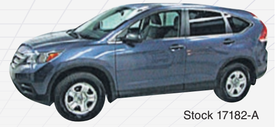
HONDA CR-V LX AWD 2014