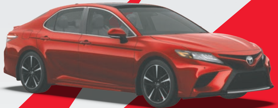
Modèle XLE V6 2018 illustré