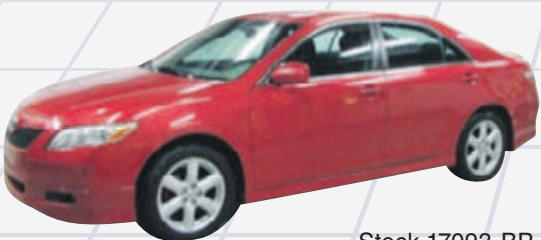
TOYOTA CAMRY SE 2007