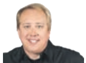
GABRIEL GÉLINAS guideautoweb.com

Le Kai Concept de Mazda est présenté à l'édition 2017 du Salon de l'auto de Tokyo et ce modèle de type hatchback nous donne une bonne indication du futur style des éventuelles petites voitures de la marque japonaise. Le Kai Concept est animé par le nouveau moteur Dans la région de Francfort en Allemagne, nous avons conduit une Mazda3 Sport modifiée et équipée de ce moteur SKYACTIV-X.