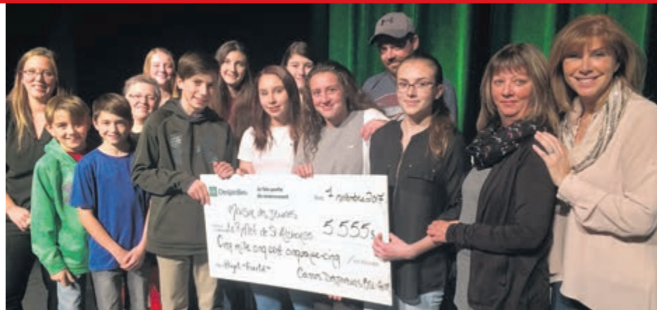
La maison des jeunes Le Reflet de Saint-Alphonse a reçu un montant de 5555$.