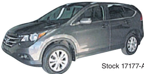
HONDA CR-V EX AWD 2014