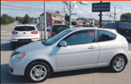
HYUNDAI ACCENT 2011

KM : 74 600 km TR : Boîte manuelle Prix: 6 495 $ - 1 000 $