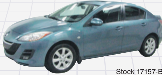
NISSAN SENTRA SE-R SPEC V 2010