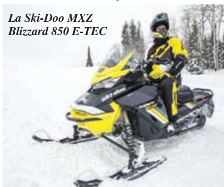
La Ski-Doo MXZ Blizzard 850 E-TEC

SURVEILLEZ L'ÉVÈNEMENT PORTES OUVERTES SKI-DOO