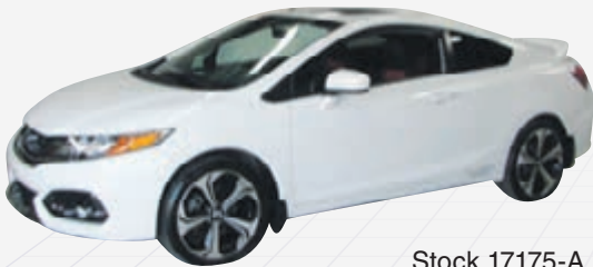
HONDA CIVIC COUPE SI 2014