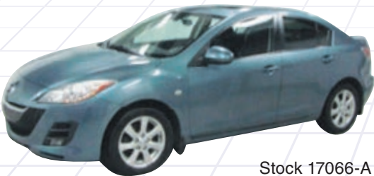
MAZDA 3 GS 2010