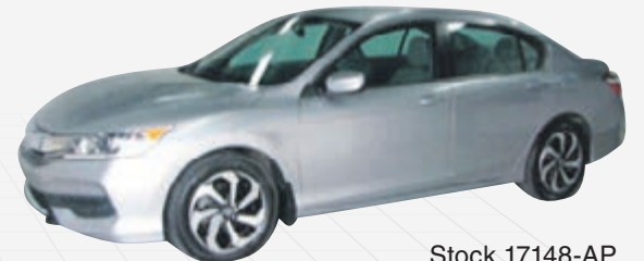
HONDA ACCORD SEDAN LX 2016