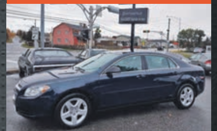
CHEVROLET MALIBU 2011

KM : 57 986 km TR : Boîte automatique Prix: 9 495 $ - 1 000 $