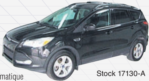
FORD ESCAPE SE 2014