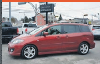
MAZDA 5 2009

KM : 117 636 km TR : Boîte automatique Prix: 25 500 $ - 1 000 $