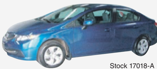
HONDA CIVIC SDN LX 2013