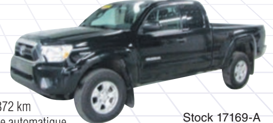
TOYOTA TACOMA SR5 2014