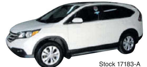
HONDA CR-V EX-L 2014