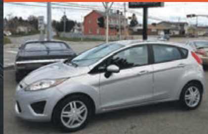
FORD FIESTA 2012

KM : 62 784 km TR : Boîte Manuelle Prix: 8 795 $ - 1 000 $