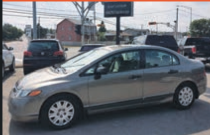
HONDA BERLINE CIVIC 2008

KM : 122 309 km TR : Boîte automatique Prix: 7 995 $ - 1 000 $