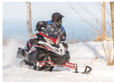
La Yamaha Apex X-TX LE 50 e

Pour souligner le 50 e anniversaire de Yamaha, on trouve des versions commémora- tives, comme la Sidewinder L-TX LE 50 e , l'Apex LE 50 e , la SRViper L-TX LE 50 e , la Sidewinder B-TX LE 153 50 e , l'Apex X-TX LE 50 e et la Sidewinder M-TX LE 162 50 e .