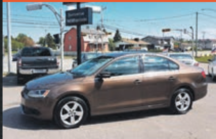
VOLKSWAGEN JETTA 2011

KM : 107 294 km TR : Boîte automatique Prix: 9 750 $ - 1 000 $