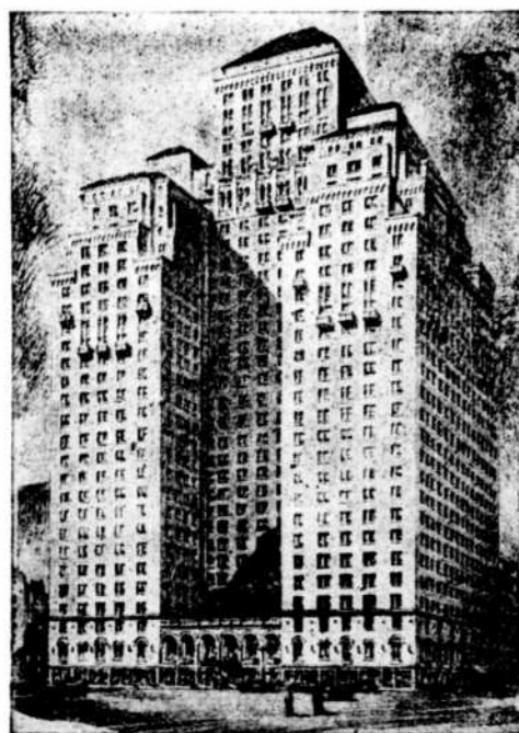
HOTEL PARK CENTRAL où logeront les voyageurs