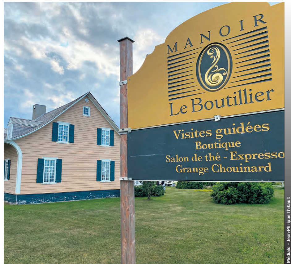
Le Manoir Le Boutillier a été classé comme monument historique par Québec en 1974.