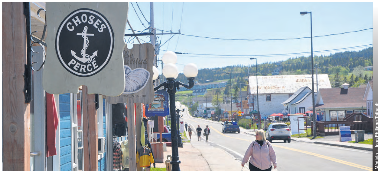
La région Gaspésie-Îles-de-la-Madeleine a enregistré plus de décès que de naissances pour une 22 e année consécutive.

Heureusement, la migration interrégionale permet d’éponger une partie de cette perte populationnelle. Depuis maintenant sept années consécutives, la région voit entrer plus de personnes qu’il n’en sort. Le solde migratoire interrégional était chiffré en mars à 304 pour la Gaspésie. Globalement, la population totale est en hausse depuis 2019, ayant passé de 89 638 habitants à 92 104 habitants l’an dernier.