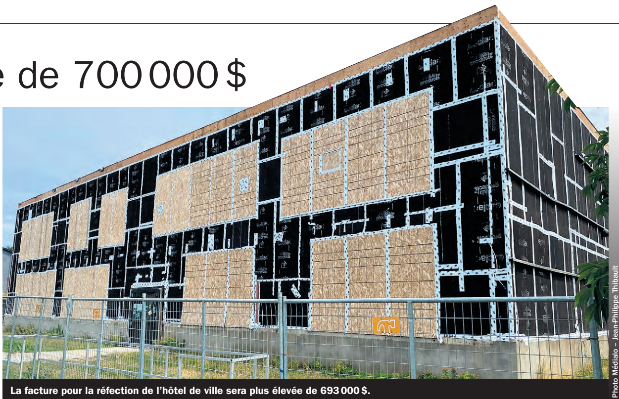
La facture pour la réfection de l'hôtel de ville sera plus élevée de 693 000 $.

La Ville de Gaspé tentera maintenant de récupérer une partie de l'argent laissé sur la table. C'est que Québec paie 65% de la note. Puisque celle-ci était plus basse que les 4,3 millions prévus initialement, la somme fournie par le provincial a aussi été revue à la baisse. L'augmentation soudaine des coûts entraîne un manque à gagner de 450 000 $ en subventions par Québec. De son côté, la Ville de Gaspé a interpellé les professionnels concernés espérant un certain dédommagement. La voie des tribunaux devra être utilisée si aucune entente à l'amiable ne survient.