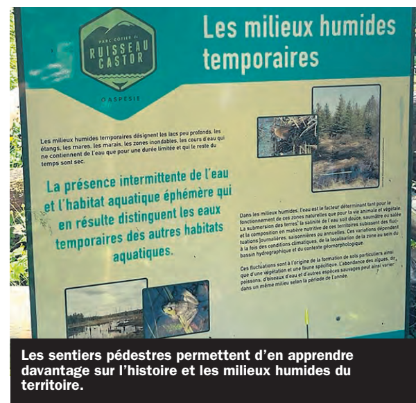
Les sentiers pédestres permettent d'en apprendre davantage sur l'histoire et les milieux humides du territoire.