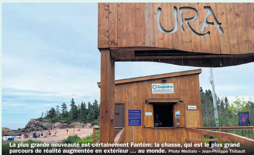
La plus grande nouveauté est certainement Fantôm: la chasse, qui est le plus grand parcours de réalité augmentée en extérieur ... au monde.