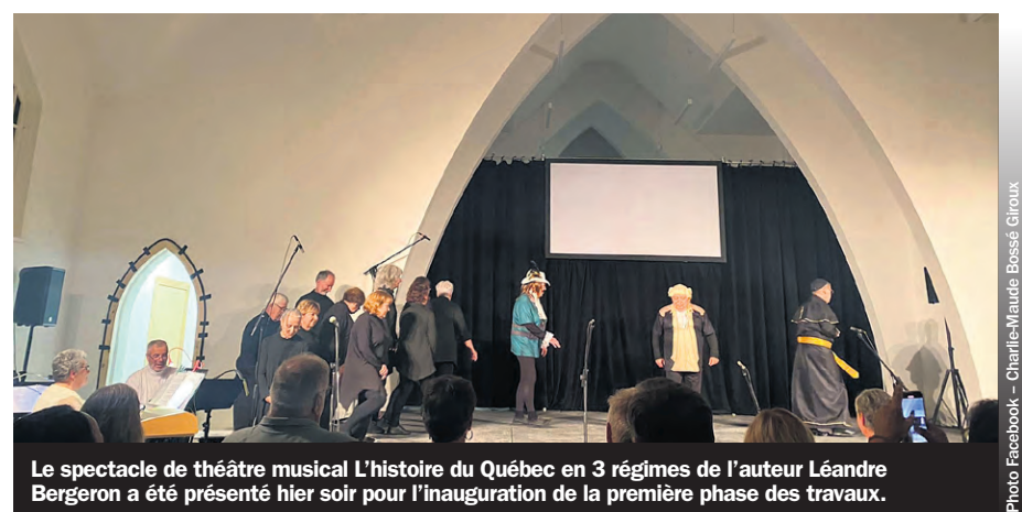
Le spectacle de théâtre musical L'histoire du Québec en 3 régimes de l'auteur Léandre Bergeron a été présenté hier soir pour l'inauguration de la première phase des travaux.

L'église Saint-Joseph a été construite entre 1942 et 1944, après que la précédente eut brûlé le 23 janvier 1939. Elle est citée comme immeuble patrimonial par la Ville de Gaspé depuis 2021. Incidemment, le revêtement extérieur en brique rouge, la toiture en tôle canadienne et sa tour de clocher détachée devraient être intégralement conservés.