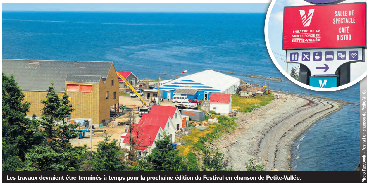
Les travaux devaient être terminés à temps pour la prochaine édition du Festival en chanson de Petite-Vallée.

«Aujourd'hui, on voit le résultat qui se concrétise et on est en droit de rêver à nouveau, de rêver à la mesure de nos ambitions