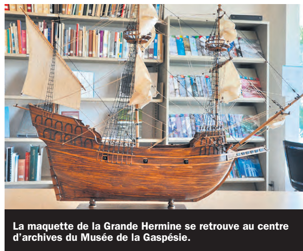
La maquette de la Grande Hermine se retrouve au centre d'archives du Musée de la Gaspésie.