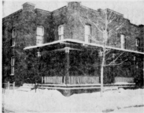
STATIONNEMENT. — Le conseil de la cité de Drummondville a pris une option sur cet immeuble dont le site sera converti éventuellement en terrain de stationnement. C'est une autre tentative du conseil d'améliorer le stationnement de la rue Lindsay.