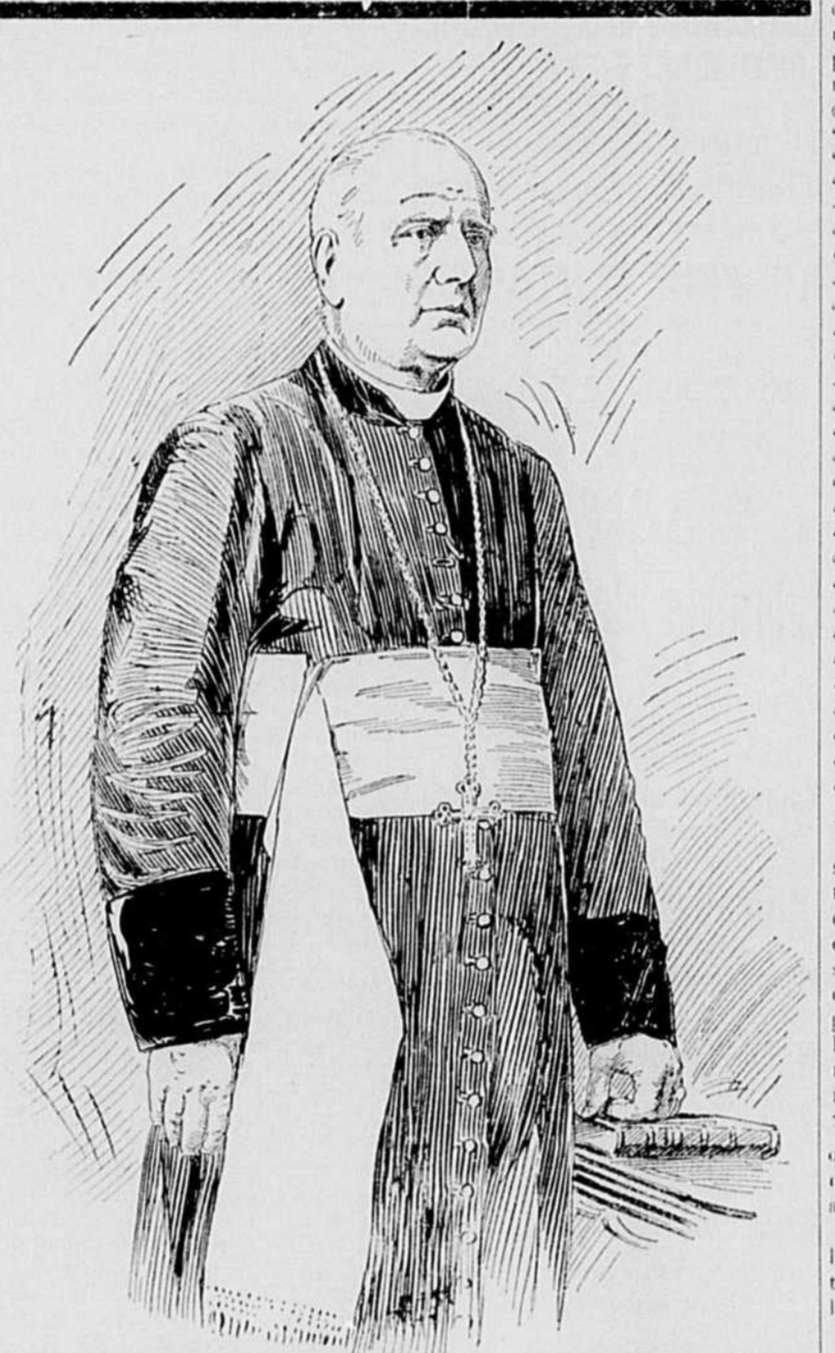
FEU SA GRANDEUR MGR. LAFLECHE.

Des Américains espèrent que les Espagnols de Puerto Rico se rendront sans qu'il soit nécessaire de combattre. La date du départ de l'escadre de