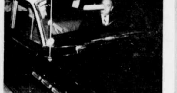
UNE SURVEILLANCE. — Cette photographie a été prise à Montréal, rue Ste-Catherine, alors que les deux détectives de la Sûreté municipale de Victoriaville, effectuait la surveillance d'un individu qu'ils recherchaient.

Ils avaient une perquisition à effectuer à Montréal, relativement à une affaire de faux chèques, une affaire qui s'étend dans plusieurs centres importants de la province.