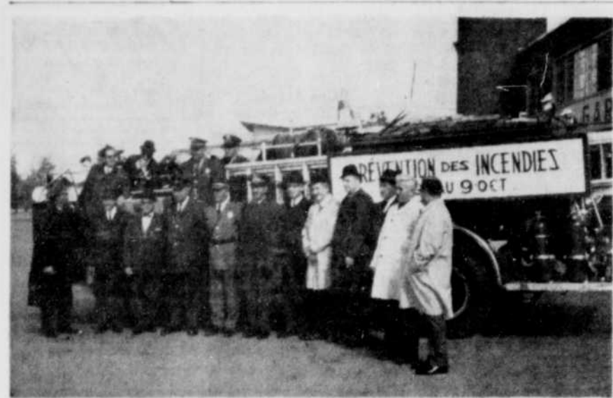
PREVENTION DES INCENDIES. — Une parade à travers les rues de la cité a marqué samedi après-midi, l'ouverture de la campagne de prévention des incendies à Drummondville. Ci-dessus, le groupe des personnalités de Drummondville et Drummondville-Sud de même que les chefs de police qui ont participé au défilé.