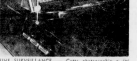
UNE SURVEILLANCE. — Cette photographie a été prise à Montréal, rue Ste-Catherine, alors que les deux détectives de la Sûreté municipale de Victoriaville, effectuaient la surveillance d'un individu qu'ils recherchoient.

La perquisition n'a pratiquement rien donné, et les deux détectives ont quitté l'appartement un peu déçus. Nous nous sommes Ste-Catherine effectuer ce que l'on appelle une surveillance. Encore là, aucun développement important