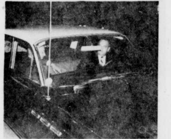
UNE SURVEILLANCE. — Cette photographie a été prise à Montréal, rue Ste-Catherine, alors que les deux détectives de la Sûreté municipale de Victoriaville, effectuait la surveillance d'un individu qu'ils recherchaient.

à Maniwaki, à quelque 50 milles de l'autre côté de Mont-Laurier. Ils devaient aller chercher une jeune fille que la police de l'endroit avait arrêtée, à la demande des limiers de Victoriaville, parce que cette dernière était portée disparue; elle n'avait pas donné de ses nouvelles depuis plusieurs mois à ses parents.