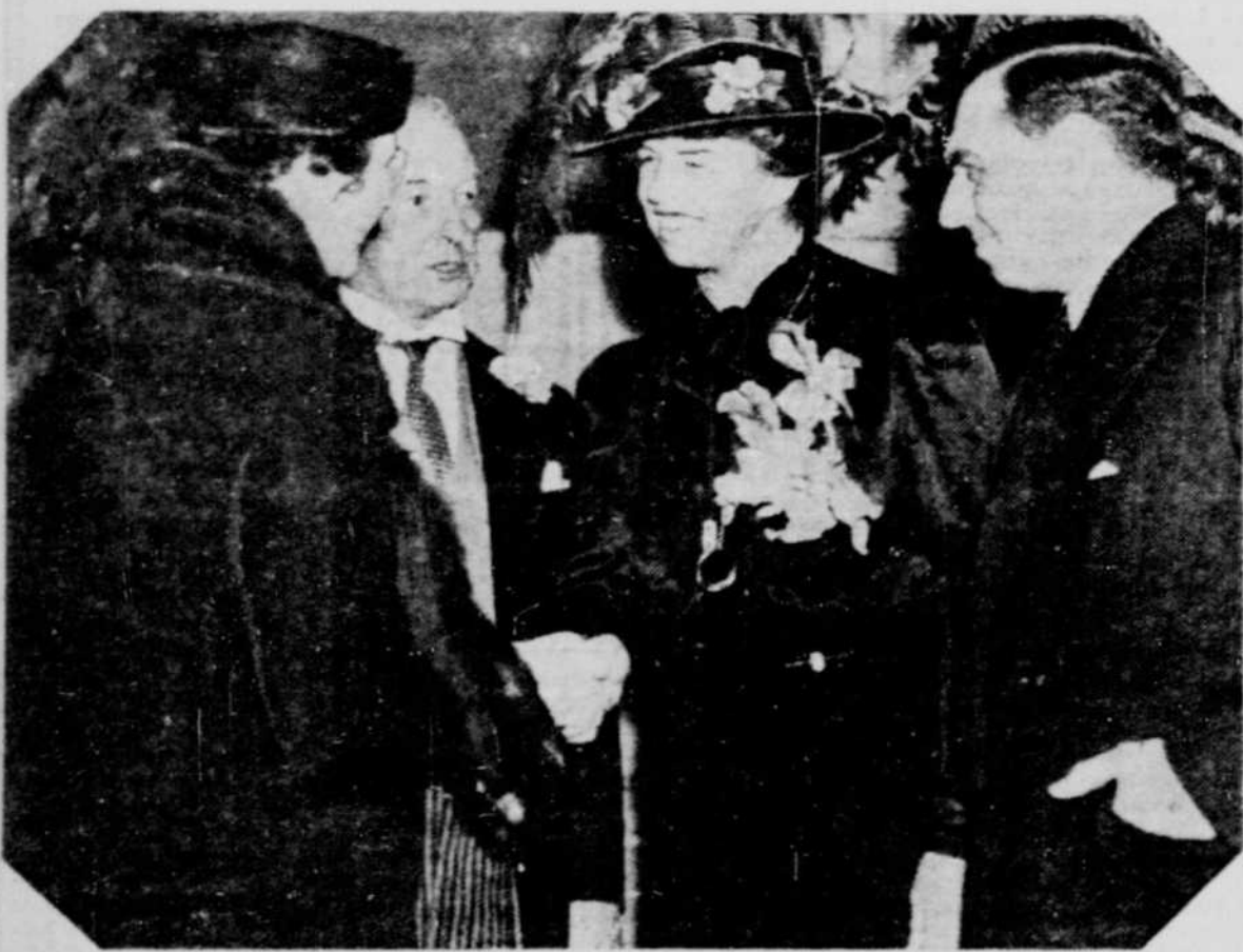
Madame Frank D. Roosevelt a arboré son plus charmant sourire pour recevoir ses nombreux invités, lors d'un thé donné à New York.