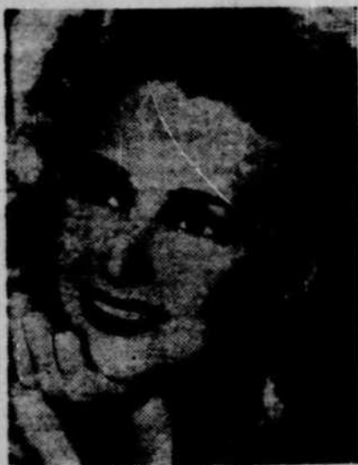
La belle Rosemary Lane est une des quatre soeurs Lane Lola, Romeray, Priscilla et Leota. Pour la première fois elles travaillent ensemble à Hollywood dans un film. Elle fut découverte par Fred Waring, alors qu'elle essayait des chansons dans un magasin de musique.

1 er tour: 1 m., passez 1 côté, 7 brides dans la côté suivante, tricotez une m., passez une côté, une m. simple dans la c. suivante, ce qui finit une