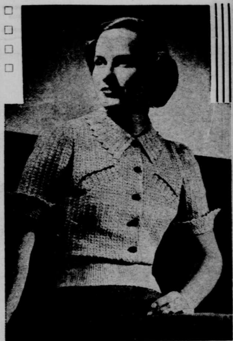
Ce charmant gilet est très facile à faire, avec du coton à tricoter mercerisé, dans un point de coquille. Frais et confortable pour l'été, il ajoutera une note personnelle à votre garde-robe et fera un agréable changement avec vos blouses tailleur.

1 er rang: 7 br. dans la 4 ème chaîne, à partir du crochet, tr. 1, passez 3, 1 m. s. dans la chaîne suivante, tr. 1, passez 3, 7 br. dans la m. suivante,