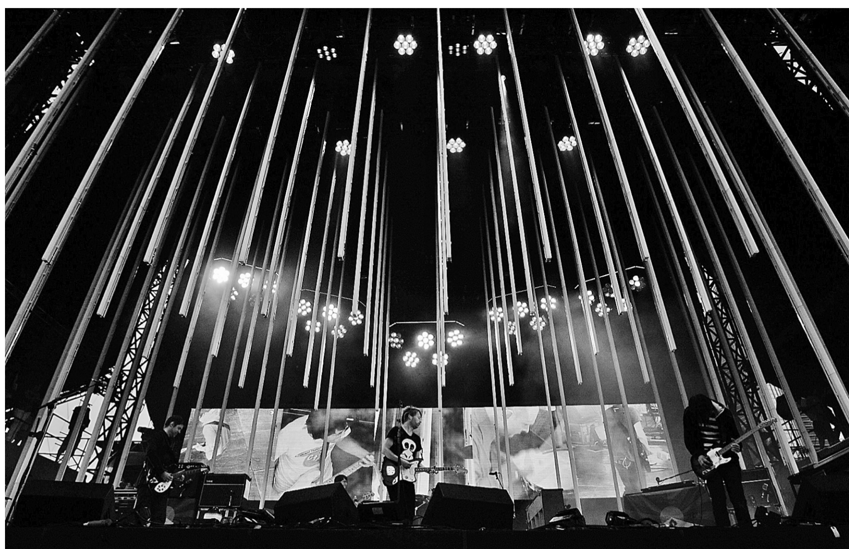
Radiohead a choisi autant que possible de se produire dans des lieux proches des centres-villes ou, si ce n'est pas possible, il incite le public à privilégier le covoiturage pour se rendre à ses concerts.

Dans la même optique, Radiohead prie ses fans de prendre les transports en commun pour se rendre au concert, on y suggère même les hyperliens du parc Jean-Drapeau et de la STM sur son site officiel! Le vélo y est aussi encouragé... Le groupe avertit en outre ses fans de ne pas se rendre en voi-