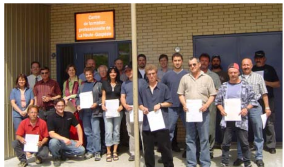
 l ves inscrits au programme Entretien g n ral d'immeubles / Cohorte 2005-2006